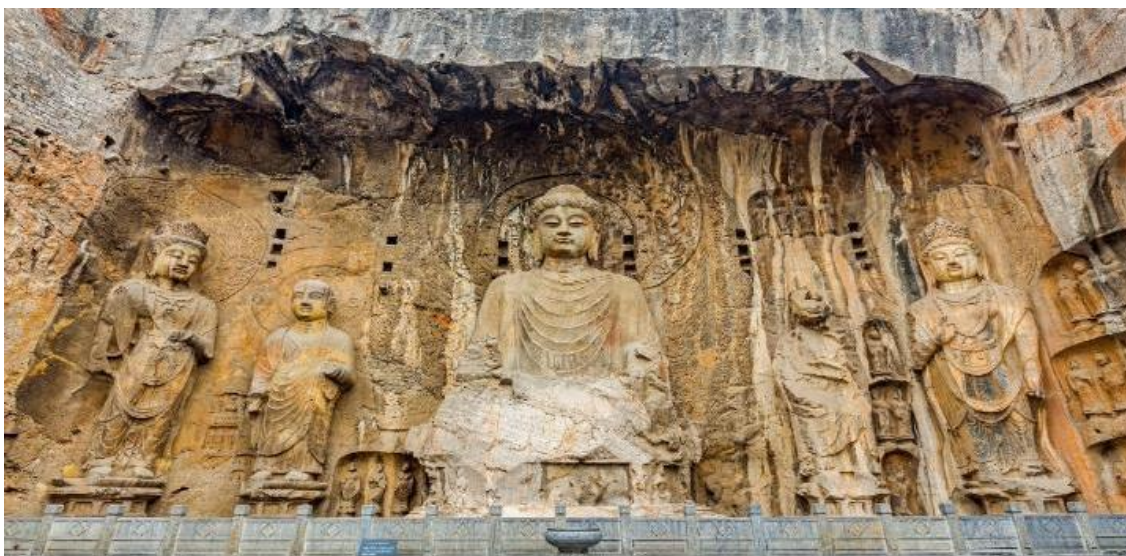
SHCZCGOLYA1 เจิ้งโจว หุบเขาหินเทียน ไทหังซาน ลั่วหยาง 6 วัน 5 คืน พ.ศ.-ต.ค.67 CZ (150224)

นำท่านเดินทางสู่ เมืองลั่วหยาง (ใช้เวลาเดินทางประมาณ 1.30 ชั่วโมง) เป็นหนึ่งในเจ็ดราชธานีเก่าแห่งแผ่นดินจีน ร่วมกับ อันหยาง ซีอาน ไคเฟิง หางโจว หนานจิง และ บักกิง เมืองแห่งนี้ถือเป็นราชธานีของจีนมาหลายยุคหลายสมัย รวมระยะเวลายาวนานกว่าพันปี 13 ราชวงศ์ มีกษัตริย์หรือฮ่องเต้เคยประทับอยู่ที่เมืองนี้กว่า 105 พระองค์ นำท่านเดินทางสู่ ถ้ำหินหลงเหมิน หมู่ถ้ำพันพระที่ตั้งอยู่ริมฝั่งน้ำอี่เจียง เป็นพุทธสถานเก่าแก่ที่สำคัญและน่าตื่นตาตื่นใจที่สุดแห่งหนึ่งของจีน สร้างราวปี พ.ศ. 1038 ในสมัยเว่ยเหนือและสร้างเพิ่มเติมเรื่อยมาจนถึงสมัยราชวงศ์ถัง โดยการเจาะหน้าผาหินให้เป็นถ้ำหรืออุโมงค์เข้าไป แล้วสลักเสลาเป็นรูปพระพุทธรูป พระโพธิสัตว์ เทวดา นางฟ้า ทวารบาล รวมถึงการเขียนภาพจิตรกรรมลงบนผนังถ้ำ สร้างโดยการอุปถัมภ์ของชนชั้นสูงในสมัยนั้นๆ บูเช็คเทียนสมัยเป็นฮ่องเฮาเคยพระราชทานพระราชทรัพย์ส่วนพระองค์เป็นจำนวนมาก เพื่อบูรณะถ้ำหินหลงเหมินแห่งนี้ การสร้างถ้ำพระพุทธรูปแห่งนี้ที่ได้รับอิทธิพลมาจากอินเดียและเอเชียกลางปัจจุบันองค์การยูเนสโกประกาศให้หลงเหมินเป็นมรดกโลกทางวัฒนธรรมในปี ค .ศ. 2000