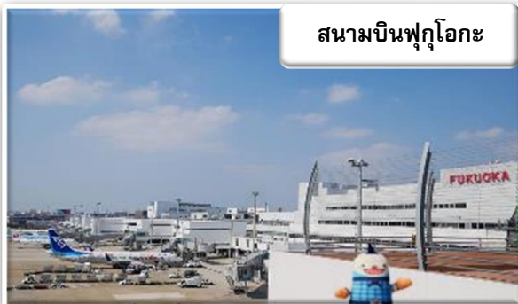
สนามบินฟุกุโอกะ

เวลา 07.05 น. เดินทางถึง สนามบินฟุกุโอกะ ประเทศญี่ปุ่น นำท่านผ่านขั้นตอนการตรวจคนเข้าเมืองและศุลกากร