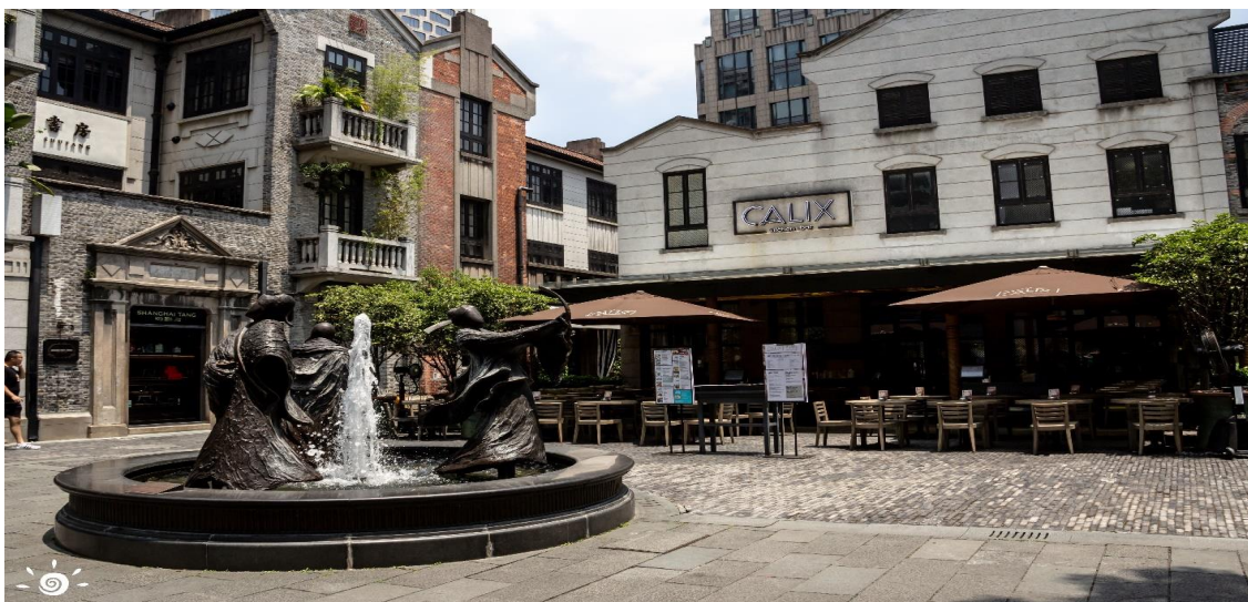
📍 พักที่ SHANGHAI HOLIDAY INN EXPRESS HOTEL หรือเทียบเท่าระดับ 4 ดาว

หลังอาหารค่ำนำท่านเที่ยวชม ซินเทียนตี้ ย่านฮิปเตอร์ใจกลางนครเซี่ยงไฮ้ ที่วัยรุ่นต้องมา กลายเป็นสถานที่ท่องเที่ยวติดอันดับต้นๆไปแล้ว สำหรับแหล่งช้อปปิ้งแห่งนี้ ไม่แพ้แหล่งช้อปปิ้งรุ่นพี่ อย่าง ถนนนานกิง ถนนอยู่เจียง Yu Yuan Bazaar ถือว่าเป็นอีก 1 ไฮไลท์เด็ดของนครแห่งนี้ เนื่องจากเอกลักษณ์ที่ไม่เหมือนใคร สิ่งปลูกสร้างที่ใช้วัสดุบล็อกแบบสถาปัตยกรรมแบบ Shikumen (ซิกเหมิน) การผสมผสานระหว่างสถาปัตยกรรมตะวันตกกับจีนเข้าด้วยกัน ทางเดินหิน กำแพงหิน ประติมากรรม บ้านเมืองเก่าแต่ดูแลรักษาอย่างดี