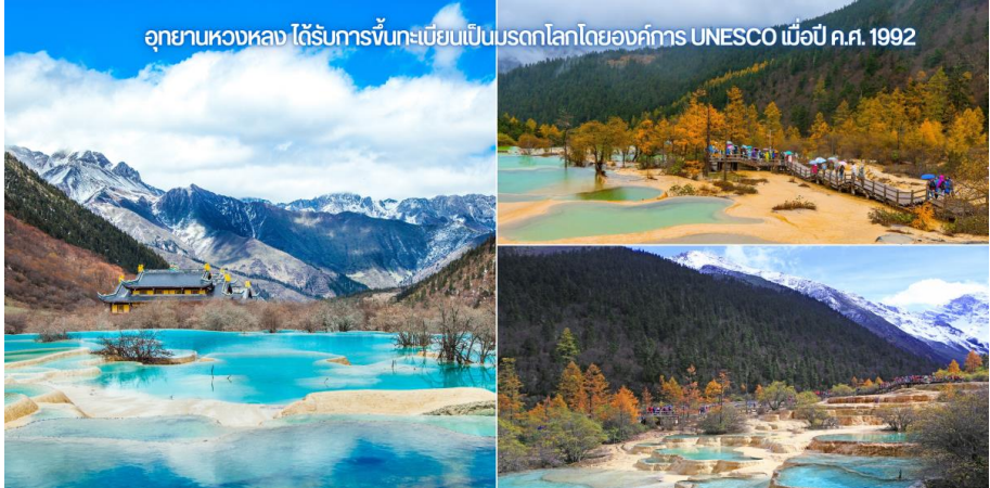
อุทยานหวงหลง ได้รับการขึ้นทะเบียนเป็นมรดกโลกโดยองค์การ UNESCO เมื่อปี ค.ศ. 1992

หมายเหตุ ** ใบไม้เปลี่ยนสีและหิมะภายในอุทยานขึ้นอยู่กับสภาพ อากาศในแต่ละปี