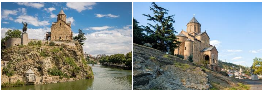
หน้าที่ 5 . ***ภาพประกอบใช้เพื่อการโฆษณาเท่านั้น***

นำท่านไปชม โบสถ์เมเทห์คี (METEKHI CHURCH) โบสถ์ที่มีประวัติศาสตร์อยู่คู่บ้านคูเมืองของทบิลีซี ตั้งอยู่บริเวณริมหน้าผาของแม่น้ำทวารี เป็นโบสถ์หนึ่งที่ตั้งอยู่ในบริเวณที่มีประชากรอาศัยอยู่ ซึ่งเป็นประเพณีโบราณที่มีมาแต่ก่อน กษัตริย์วาคตัง ที่ 1 แห่งจอร์กาซาลี ได้สร้างป้อมและโบสถ์ไว้ที่บริเวณนี้