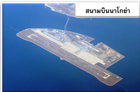
สนามบินนาโกย่า

บริการอาหารร้อนบนเครื่องพร้อมกับเมนูผลไม้สดเพื่อเติมเต็มความพิเศษไปพร้อมกับความสดชื่น