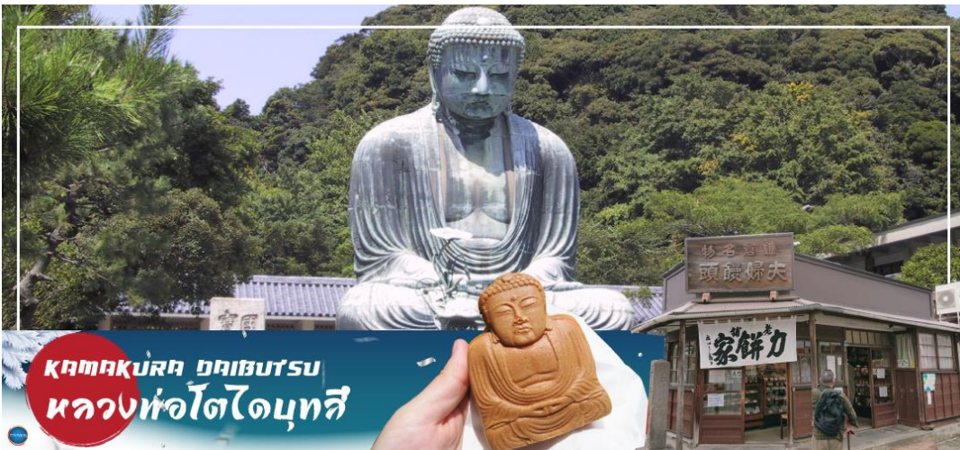
กรุงเทพมหานคร ภูเก็ต หลวงหัวโตโอบุทสึ

เมืองคานากาวะ - เทศกาลประดับไฟซากะมิโกะ - เมืองยามานาชิ - ออนเซ็น + ชาบูยักษ์