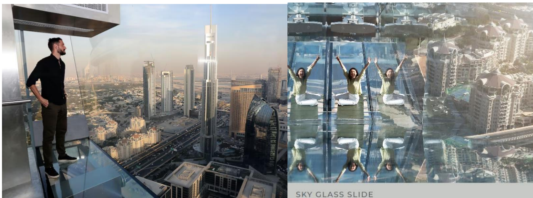
SKY GLASS SLIDE

22.30 น. ได้เวลาพอสมควรนำท่านเดินทางสู่ สนามบินดูไบ เพื่อเดินทางกลับสู่ กรุงเทพฯ → เหินฟ้าสู่ ท่าอากาศยานสุวรรณภูมิ โดยสายการบิน EMIRATES เที่ยวบิน EK374 (บริการอาหารบนเครื่อง ใช้เวลาบิน 6.40 ชั่วโมง)