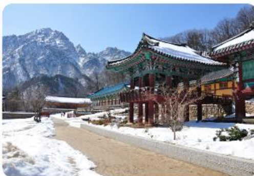
แห่งนี้ได้