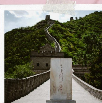
กำแพงเมืองจีน ด่านจวิหยงกวน