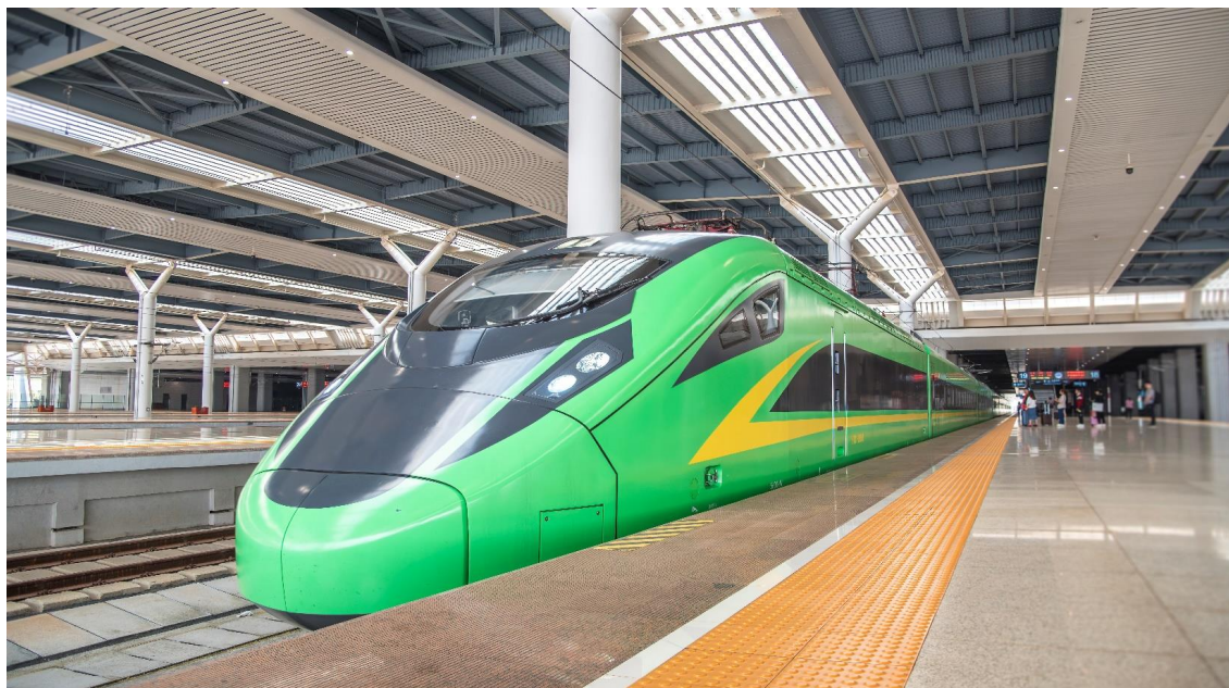
SHTGUTHKMG1 อู๋ตอร์ เวียงจันทน์ สิบสองปันนา คุณหมิง 6 วัน 5 คืน มี.ค.-ต.ค. 67 TG-KY(150124)

นำท่านเดินทางสู่ สถานีรถไฟสิบสองปันนา เพื่อโดยสาร รถไฟความเร็วสูง มุ่งหน้าสู่ คุณหมิง (ใช้เวลาเดินทางประมาณ 3 ชั่วโมง) ทั้งนี้อาจจะมีการเปลี่ยนแปลงขบวนรถไฟ หมายเหตุ : เพื่อความรวดเร็วในการขึ้น-ลงรถไฟ กระเป๋าเดินทาง และสัมภาระของแต่ละท่านจำเป็นต้องลากด้วยตนเอง จึงควรเลือกใช้กระเป๋าเดินทางแบบคันชักล้อลากที่มีขนาดไม่ใหญ่จนเกินไป