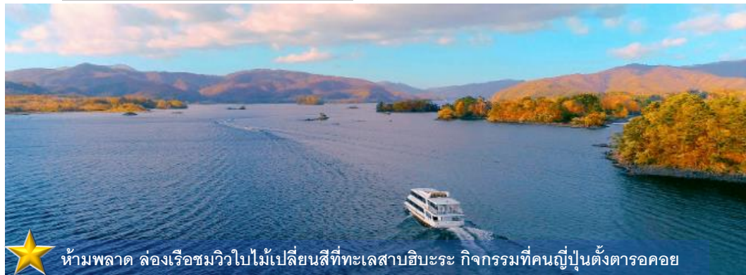
ห้ามพลาด ล่องเรือชมวิวใบไม้เปลี่ยนสีที่ทะเลสาบฮิบะระ กิจกรรมที่คนญี่ปุ่นตั้งตารอคอย