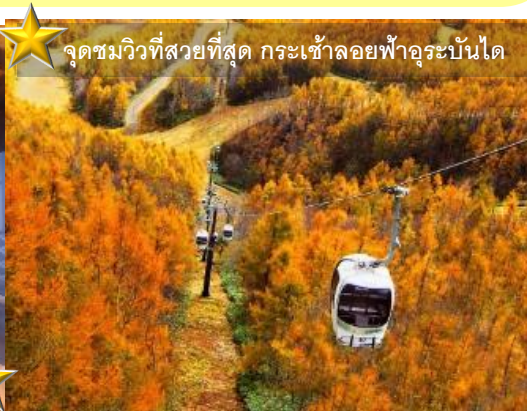
จุดชมวิวที่สวยงามที่สุด กระเช้าลอยฟ้าอูระบันได