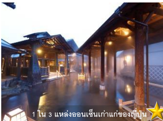
1 ใน 3 แหล่งออนเซ็นเก่าแก่ของญี่ปุ่น