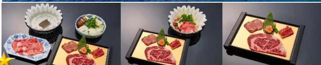
ROKKASEN มีอพิเศษกับบุฟเฟ่ต์ปิ้งย่างพรีเมียม พร้อม SOFT DRINK แบบไม่อั้น!!!

SHTGNRT7 TOKYO URABANDAI 19-24, 23-28 OCT 2024 TG / HNOO + BORN (RE200624)