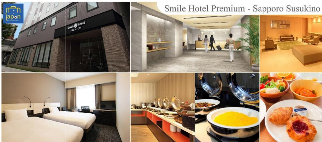
Smile Hotel Premium - Sapporo Susukino

รับประทานอาหารเย็น ณ กัดดาการ (2) พิเศษ!!! เมนู นูฟเฟ็ตซามู + ซามู SMILE HOTEL PREMIUM - SAPPORO SUSUKINO หรือเทียบเท่าระดับเดียวกัน