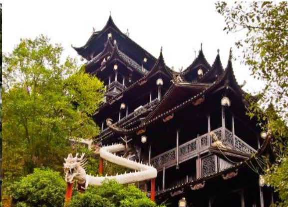
UPDATE 14 AUG 2024