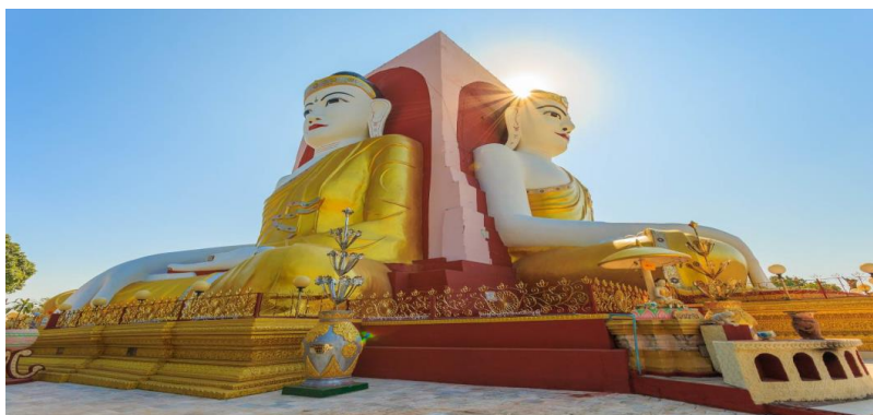
อาคารโฆษณาเท่านั้น***

นำท่านเดินทางสู่ เมืองหงสาวดี หรือ เมืองพะโค ซึ่งในอดีตเป็นเมืองหลวงที่เก่าแก่ที่สุด ของเมืองมอญ โบราณที่ยิ่งใหญ่และอายุมากกว่า 400 ปี อยู่ห่างจากย่างกุ้ง (ระยะทางประมาณ 80 กิโลเมตร ใช้เวลาเดินทางประมาณ 1.45 ชม.) นำท่านนมัสการ พระพุทธรูปเจ้ปุ่น เป็นพระเจดีย์ที่มีพระพุทธรูปปางมารวิชัย ขนาดใหญ่ทั้ง 4 ด้านอายุกว่า 500 ปี หันพระพักตร์ไปยัง 4 ทิศ สร้างขึ้นโดย 4 สาวพี่น้องที่อุทิศตนแต่พุทธศาสนาจึงสร้างพระพุทธรูปเพื่อแทนตนเอง และได้สาบานไว้ว่าจะไม่ข้องแวะกับบุรุษเพศ ต่อมาน้องสาวคนสุดท้อง กลับพบรักกับชายหนุ่มและแต่งงานกัน จึงเกิดอาเพศฟ้าผ่าพระพุทธรูปที่แทนตัวของน้องสาวคนสุดท้องพังทลายลงมา และมีการบูรณะขึ้นมาใหม่จึงทำให้พระพุทธรูปองค์นี้จะมีลักษณะ แตกต่างจากองค์อื่นๆ