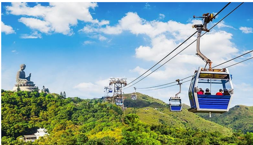
หน้าที่ 10 | ภาพประกอบใช้เพื่อการโฆษณาเท่านั้น

จากนั้นนำท่านเดินทางสู่ เกาะลันเตา นำท่านขึ้น กระเช้ามองปีง 360 องศา (STANDARD CABIN) นำท่านนมัสการ พระใหญ่เทียนถาน ณ วัดโป่วหลิน หรือ นิยมเรียกว่าพระใหญ่ลันเตา องค์พระสร้างทองสัมฤทธิ์ 160 ชั้น องค์พระพุทธรูปหันพระพักตร์ไปทางเหนือสู่จีนแผ่นดินใหญ่ ประดิษฐานอยู่โดยมีความสูง 26.4 เมตรบนฐานดอกบัว หากนับรวมฐานแล้วมีความสูงทั้งสิ้น 34 เมตร ค่าก่อสร้างพระพุทธรูป 60 ล้านบาทอยู่สองกึ่ง โดยพระพุทธรูปมีชื่อเรียกอย่างไม่เป็นทางการว่า พระใหญ่เทียนถาน ประดิษฐานบนแท่นบูชาที่มีความสูงเท่ากับตึก 3 ชั้นออกแบบตามฐานโครงสร้างของหอฟ้าเทียนถานในปีกั้ง