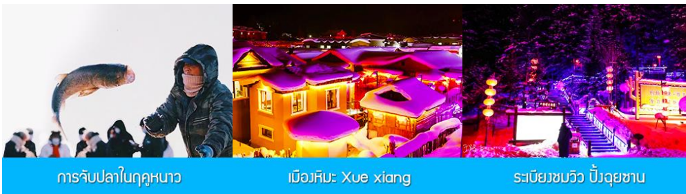
การจับปลาในฤดูหนาว

นำท่านชม การจับปลาในฤดูหนาว 冬捕 เป็นวิธีการจับปลาตามแม่น้ำและแหล่งน้ำในฤดูหนาวที่สืบทอดกันมายาวนาน โดยชาวบ้านจะนำแหดักปลาวางดักไว้ตามจุดต่าง ๆ ก่อนที่ผิวน้ำจะปกคลุมด้วยน้ำแข็ง หลังจากผิวน้ำกลายเป็นน้ำแข็งแล้ว ชาวบ้านจะเจาะพื้นน้ำแข็งบริเวณที่มาวางดักอยู่เพื่อยกแหขึ้น จะมีปลาติดแหเป็นจำนวนมาก...พิเศษ ให้ท่านได้ชมการยกแหดักปลาจากสถานที่จริง และให้ท่านได้ชิมซูปเนื้อปลาสด ๆ ที่ได้จากแหดักปลา