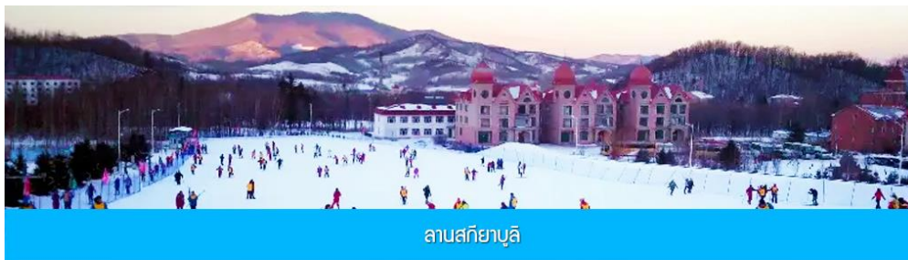
ลานสกียาบูลิ

วันที่สาม เมืองฮาร์บิน-ลานสกียาบูลิ-ชมการจับปลาฤดูหนาว-หมู่บ้านหิมะ Snow Town-ระเปียงชม วิวปั้งลุยซาน-ถนน Xue Yun Da Jie