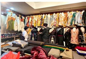
ศูนย์จำหน่ายอุปกรณ์กันหนาว