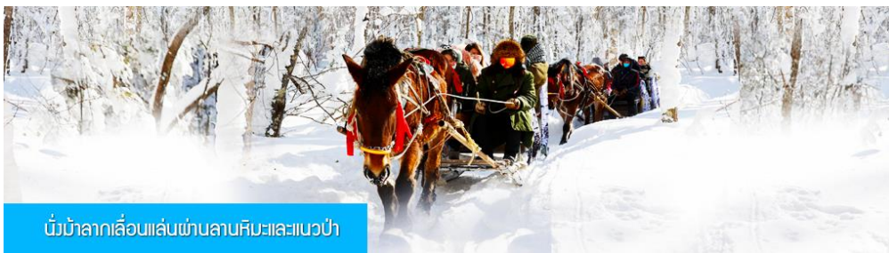
นั่งม้าลากเลื่อนผ่านลานหิมะและแนวป่า

ต้นไม้ที่มีน้ำแข็งเกาะอยู่ตามกิ่งไม้ เป็นภาพวิวธรรมชาติฤดูหนาวที่สวยงามน่าประทับใจและพบได้เฉพาะในฤดูหนาวทางภาคอีสานของจีนเท่านั้น เวลาที่ใช้สำหรับ โปรแกรมเสริมนี้ประมาณ 1 ชั่วโมง อัตราค่าบริการ ท่านละ 220 หยวน หรือ 1100 บาท อัตรานี้รวมค่าบริการผ่านเข้าอุทยาน ค่ารถรับ ส่ง และค่าบริการของไกด์ท้องถิ่น และค่าบริการจัดการของบริษัททัวร์ท้องถิ่น.....หมายเหตุ โปรแกรมเสริมเป็นโปรแกรมที่ท่านต้องเสียค่าใช้จ่ายเองด้วยความสมัครใจ สำหรับท่านที่ไม่เข้าร่วมกิจกรรมดังกล่าวสามารถนั่งพักในรถได้