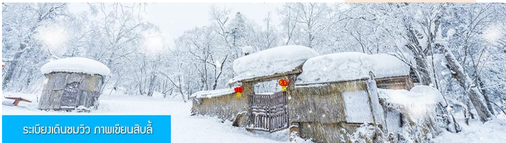
ระเบียบดินซบวิว ภาพเขียนสิบลี้

ระหว่างทางไกด์ท้องถิ่นจะเสนอขายโปรแกรมเสริมที่ไม่ได้รวมในค่าทัวร์ (ออฟชั่นแนล ทัวร์) 2 รายการ