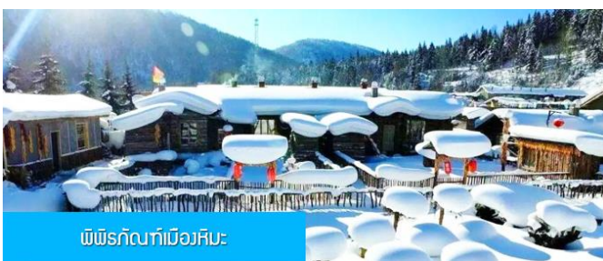
พืชรักบี้ที่เมืองหิมะ

หมายเหตุ การไปพักในเมืองหิมะทางทัวร์ไม่สามารถจัดรถทัวร์ไปส่งรถทัวร์ถึงหน้าโฮมสเตย์ได้ ทางคณะต้องนั่งรถเมล์หมู่บ้านเข้าไป โดยรถทัวร์ต้องถือหรือลากกระเป๋าเข้าที่พักด้วยตัวเอง เพราะโฮมสเตย์จะไม่มีพนักงานยกกระเป๋า มาคอยบริการยกกระเป๋าให้ผู้เข้าพัก ท่านควรจัดเตรียมกระเป๋าใบเล็กที่บรรจุเสื้อผ้า และเครื่องใช้จำเป็นสำหรับการพักผ่อน ณ โฮมสเตย์ในเมืองหิมะในคืนนี้ เพื่อสะดวกต่อการเคลื่อนย้ายกระเป๋า, และภายในห้องพักจะไม่มีผ้าเช็ดตัวผืนใหญ่ จะมีเพียงสบู่ แชมพูบริการทุกโรงแรม ท่านควรเตรียมแปรงสีฟันยาสีฟันติดไปด้วย