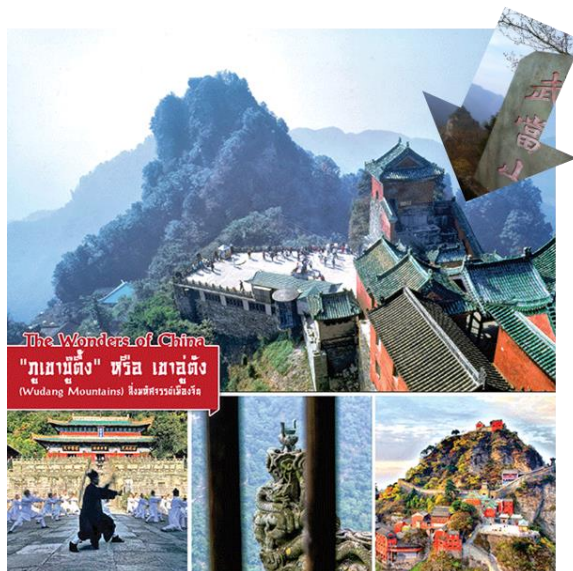
The Wonders of China "ภูเขาบู๊ตึ้ง" หรือ ภูเขาบู๊ตึ้ง (Wudang Mountains) ไข่มุกแห่งมรดกโลก

(รับประทานอาหารกลางวันบนเขา) เมืองอูต้ง หรือ บู๊ตึ้ง อุทยานขึ้นเขาบู๊ตึ้ง ก่อนจะขึ้นกระเช้าไปถึงยอดเขา เที้ยวชม สารพัดสถานที่สำคัญบนเขาตั้งแต่เช้าจรดเย็น สัมผัสกับ 9 ตำหนัก 8 วิหารมีอีกชื่อว่า ไท่เหอซัน เป็นเทือกเขาที่มีความสำคัญของ ลัทธิเต๋า เขตโบราณสถานบนเขาบู๊ตึ้ง มีพื้นที่รวมทั้งสิ้น 321 ตารางกิโลเมตร ประกอบด้วยส่วนที่เป็นหมู่ตึกโบราณซึ่งเป็นแหล่งท่องเที่ยวทางวัฒนธรรม และส่วนที่เป็นทิวทัศน์ธรรมชาติ อาทิ สระน้ำ, บ่อน้ำพุร้อน, ถ้ำ, หน้าผาและยอดเขารวมกว่าร้อยแห่ง สิ่งที่น่าอัศจรรย์ คือ ยอดเขาทั้งหลายได้หันหน้าเข้าหากันที่จุดศูนย์รวมตั้งกลีบดอกบัวสวรรค์ และในปี ค.ศ. 1997 ได้รับรางวัลมรดกโลกทางวัฒนธรรมและธรรมชาติจากองค์การยูเนสโก