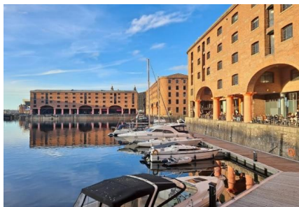
UK-01 GRAND UK 8D