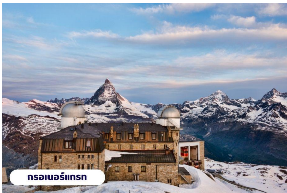
กรอนเนอร์เกรท