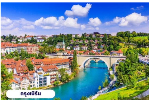
กรุงเบิร์น

📍 บริการอาหารเช้า ณ ห้องอาหารของโรงแรม จากนั้นนำท่านเที่ยวชมสถานที่สำคัญต่างๆในกรุงเบิร์น กรุงเบิร์นได้รับการยกย่องจากองค์การยูเนสโกให้เป็นเมืองมรดกโลก ในปี ค.ศ. 1863 นอกจากนี้เบิร์น ยังถูกจัดอันดับอยู่ใน 1 ใน 10 ของเมืองที่มีคุณภาพชีวิตที่ดีที่สุดในโลกในปี ค.ศ. 2010 นำท่านชม บ่อหมีสีน้ำตาล สัตว์ที่เป็นสัญลักษณ์ของกรุงเบิร์น นำท่านชม มาร์กาสเซ ย่านเมืองเก่า ปัจจุบันเต็มไปด้วยร้านดอกไม้และบูติก เป็นย่านที่ปลอดภัยนึ่ง จึงเหมาะกับการเดินเที่ยวชมอาคารเก่า อายุ 200-300 ปี นำท่านลัดเลาะชมถนนจุงเคอร์นกาสเซ ถนนที่มีระดับสูงสุดของเมืองนี้ ซึ่งเต็มไปด้วยร้านภาพวาดและร้านขายของเก่าในอาคารโบราณ ชมนาฬิกาใช้ทศลือคเค่นทริม อายุ 800 ปี ที่มีโชว์ให้ดูทุกๆชั่วโมงในการตีบอกเวลาแต่ละครั้ง หอนาฬิกานี้ ในช่วงปี ค.ศ. 1191-1256 ใช้เป็นประตูเมืองแห่งแรก ภายหลังได้ดัดแปลงใช้ทศลือคเค่นทริมให้กลายเป็นหอนาฬิกา พร้อมติดตั้งนาฬิกาดาราศาสตร์เข้าไป จากนั้นอิสระให้ท่านเดินเล่นและเก็บภาพตามอัธยาศัยหรือจะเลือกซื้อปิ้งซื้อสินค้าแบรนด์เนมและซื้อของที่ระลึก