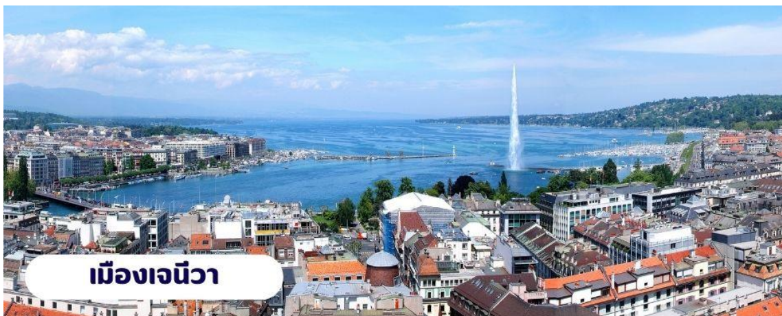
เมืองเจนีวา