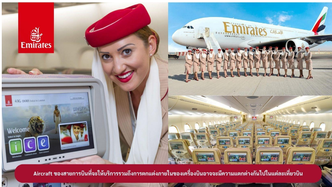
Aircraft ของสายการบินที่จะให้บริการรวมถึงการตกแต่งภายในของเครื่องบินอาจจะมีความแตกต่างกันไปในแต่ละเที่ยวบิน