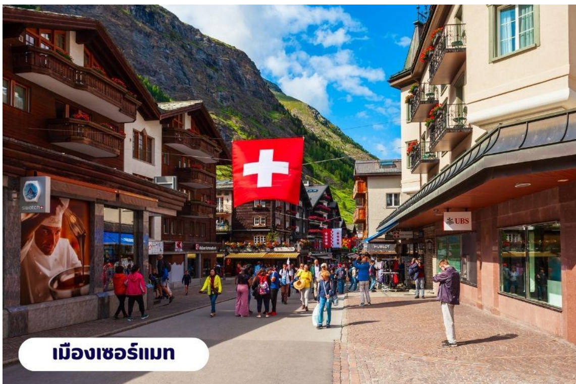
เมืองเซอร์แมท

เช้า บริการอาหารเช้า ณ ห้องอาหารของโรงแรม จากนั้นนำท่านเดินทางสู่ เมืองแทสซ์ (Tasch) ใช้เวลาเดินทางประมาณ 2.30 ชั่วโมง ตั้งอยู่ในประเทศสวิตเซอร์แลนด์ เป็นประเทศขนาดเล็กที่ไม่มีทางออกสู่ทะเล และตั้งอยู่ในทวีปยุโรปตะวันตก ซึ่งมีเทือกเขาแอลป์ ซึ่งเป็นเทือกเขาที่ใหญ่ที่สุดของทวีปยุโรป เลาะเลียบบตามหุบเขา ชมทิวทัศน์สวยอันงดงามตลอดเส้นทาง จากนั้นนำท่านเดินทางโดยรถไฟสู่เมืองเซอร์แมท (Zermatt) ใช้เวลาเดินทางประมาณ 15 นาที โดยรถไฟซึ่งเป็นเมืองที่ไม่อนุญาตให้รถยนต์วิ่งและเป็นเมืองที่ได้รับการยกย่องว่า ปลอดภัยที่สุดในโลกตั้งอยู่บนความสูงกว่า 1,620 เมตร ซึ่งเป็นที่ตั้งของยอดเขาแมทเทอร์ฮอร์น ซึ่งเป็นสัญลักษณ์ของสวิตเซอร์แลนด์ เมืองเซอร์แมทเป็นเมืองเล็กๆ หรืออาจจะเรียกได้ว่าเป็นหมู่บ้านก็ได้ เพราะว่ามีประชากรในเมืองไม่ถึง 10,000 คน ทางตอนใต้ของสวิตติดกับชายแดนอิตาลี โดยมี Pennine Alps ซึ่งเป็นส่วนหนึ่งของเทือกเขา Alps เป็นเส้นกั้นระหว่าง 2 ประเทศหากพูดถึง Zermatt ก็ต้องนึกถึงยอดเขาแหลมที่มีลักษณะคล้ายปิรามิด ชื่อว่า Matterhorn ที่ตั้งตระหง่านอยู่ใกล้ๆ เมือง มีความสูงถึง 4,478 เมตร สามารถมองเห็นได้จากแทบทุกมุมของเมือง ซึ่ง Matterhorn นี้ถือเป็นสัญลักษณ์ที่สำคัญของ Zermatt