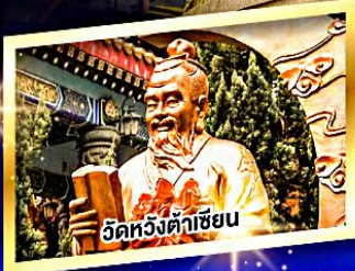
วัดหวังคำเซียน