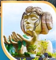
โมอาน่า ซาปาคาเฟ่