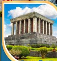
สุสานประธานโฮจิมินห์