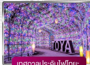
เทศกาลประดับไฟโทยะ