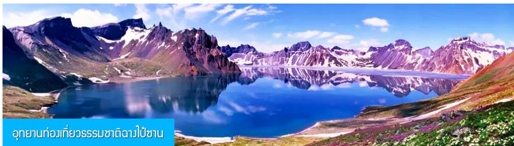
อุทยานก่องกิ่วธรรมชาติจางไป๋ชาน