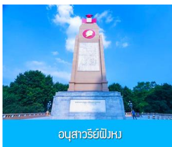
อนุสาวรีย์ฝังหง

เช้า รับประทานอาหารเช้า ณ ห้องอาหารของโรงแรม หลังอาหารนำท่าน ชมการแสดงว่ายน้ำในแม่น้ำซางฮัวเจียง 冬泳表演 ของชนพื้นเมือง ท่ามกลางสภาพอากาศหนาวเย็นด้วยอุณหภูมิติดลบ 20 องศา.....นำท่านชม โบสถ์โซเฟีย 索菲亚教堂 (ชมด้านนอก) อีกหนึ่งสัญลักษณ์ที่โดดเด่นของเมืองฮาร์บิน สร้างขึ้นในปี ค.ศ. 1907 เป็นโบสถ์คริสต์นิกายออร์ทอดอกซ์ที่ใหญ่ที่สุดในเอเชียตะวันออกเฉียงใต้ที่แสดงถึงอิทธิพลของวัฒนธรรมรัสเซียที่มีต่อเมืองฮาร์บิน..... ชมและถ่ายภาพกับ รูปปั้นตึกตาคิมะยักซ์ 网红大雪人 เป็นตึกตาคิมะขนาดใหญ่ความสูง 18 เมตร ที่ทางเทศบาลเมืองฮาร์บินจัดทำขึ้นในช่วงฤดูหนาวของทุกปี เช่นเดียวกับการประดับต้นคริสมาสในช่วงเทศกาลของชาวตะวันตก จนกลายเป็นสัญลักษณ์แห่งฤดูหนาวของเมืองฮาร์บิน