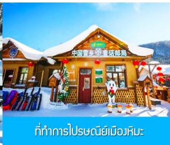
ที่ทำการไปรษณีย์เมืองหิมะ:

วันที่หก พิพิธภัณฑหมู่บ้านหิมะ-ที่ทำการไปรษณีย์หมู่บ้านหิมะ-เลือกซื้อโปรแกรมเสริมระเบียบงภาพหิมะสิบลิ-เลือกซื้อโปรแกรมเสริม Snow Mobile Riding - เมืองฮาร์บิ้น