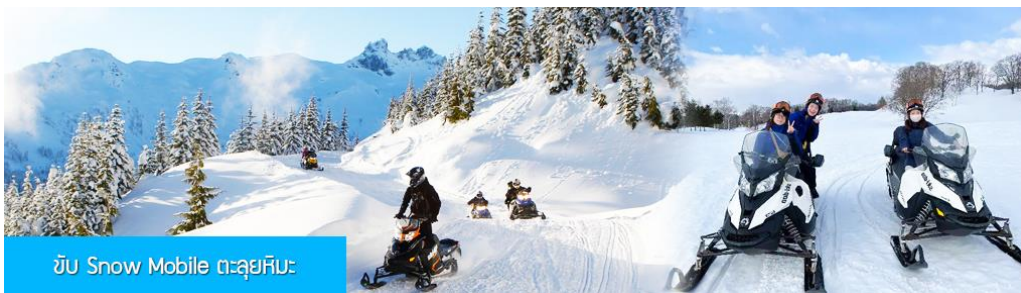
ขับ Snow Mobile ตะลุยหิมะ

ค่าบริการ ท่านละ 300 หยวน หรือ 1500 บาท อัตรานี้รวมค่าบัตรผ่านเข้าอุทยาน ค่ารถรับ ส่ง และค่าบริการของไกด์ท้องถิ่น และค่าบริการจัดการของบริษัททัวร์ท้องถิ่น.....หมายเหตุ โปรแกรมเสริมเป็นโปรแกรมที่ท่านต้องเสียค่าใช้จ่ายเองด้วยความสมัครใจ สำหรับท่านที่ไม่เข้าร่วมกิจกรรมดังกล่าวสามารถนั่งพักในรถได้