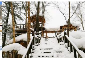
ระเบียงชมวิวบึงวูชาน