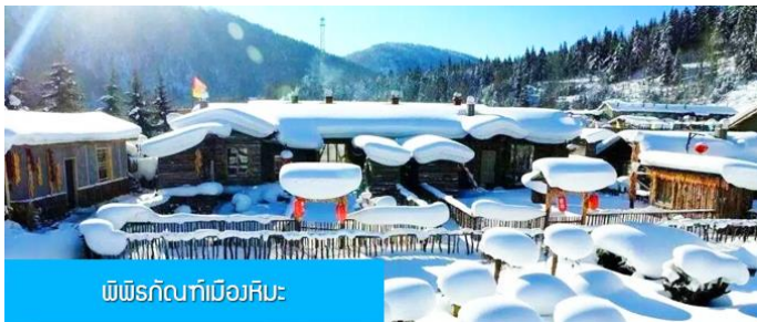
พิพิธภัณฑ์เมืองหิมะ:

พนักงานขกกระเป๋ามาคอบริการขกกระเป๋าให้ผู้เข้าพัก ท่านควรจัดเตรียมกระเป๋าใบเล็กที่บรรจุเสื้อผ้า และเครื่องใช้จำเป็นสำหรับการพักผ่อน ณ โฮมสเตย์ในเมืองหิมะในคืนนี้ เพื่อสะดวกต่อการเคลื่อนย้ายกระเป๋า หมายเหตุ 2 ห้องพักในหมู่บ้านหิมะเป็น โฮมสเตย์ขนาดเล็ก เครื่องอำนวยความสะดวกและบริการอาหารมีค้ำและมือเช้าจะไม่ทัดเทียมกับโรงแรมในเมือง และมีอาหารในภัตตาคารได้, ท่านควรเตรียมผ้าเช็ดตัวแปรงสีพื้น ขาสีพื้น และเครื่องใช้ส่วนตัวที่จำเป็นนำติดตัวไปด้วย