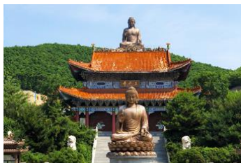
องค์พระพุทธรูปใหญ่จันต๊ว

ค่ำ รับประทานอาหารค่ำ ณ ภัตตาคาร พักที่ WAN HAO INTER HOTEL 4* หรือ โรงแรมในระดับเดียวกัน เมืองตุนฮว่า