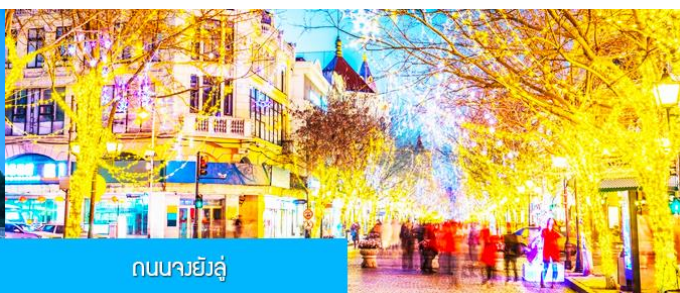
ถนนจงหยางต้า