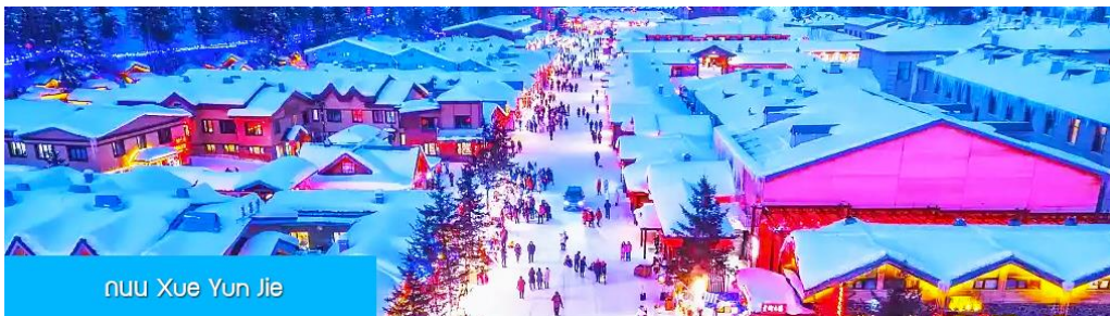
ถนน Xue Yun Jie