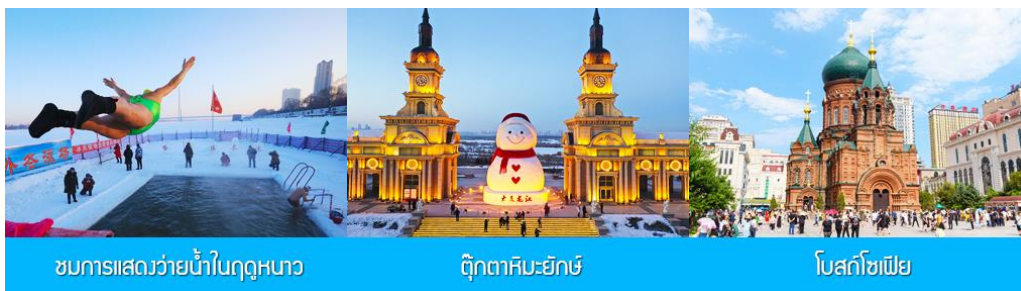
ชมการแสดงว่ายน้ำในฤดูหนาว

ค่ำ รับประทานอาหารค่ำ ณ ภัตตาคาร พักที่ HARBIN SHUIMU CITY SPRING HOTEL 4* หรือโรงแรมในระดับเดียวกันย่านชานเมืองฮาร์บิ้น