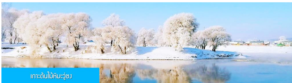
เกาะต้นไม้หิมะฮูย

พักที่ RENWICK HOTEL 4* หรือ โรงแรมในระดับเดียวกันในเมืองจีหลิน