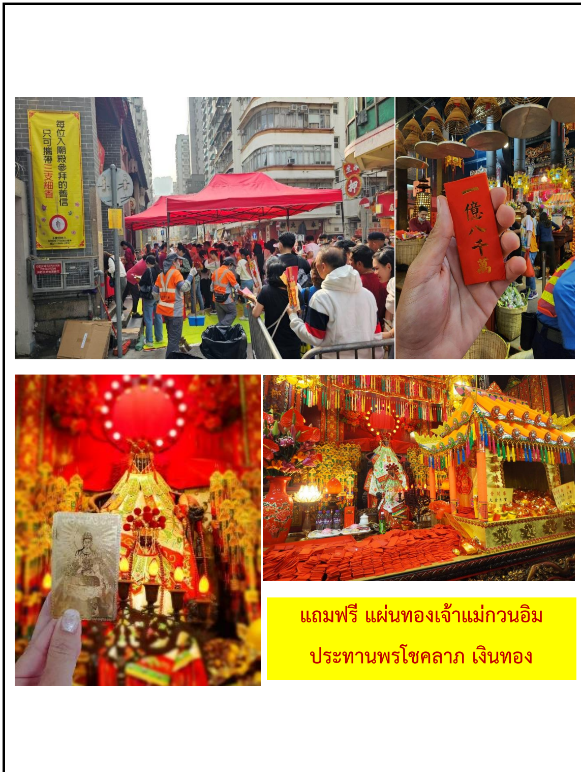
แถมฟรี แผ่นทองเจ้าแม่กวนอิม ประธานพรโชคลาก เงินทอง

** ชำระค่าทัวร์ในนามบริษัท ไลออน ทราเวล จำกัด เท่านั้น **