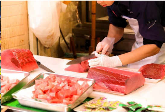
เที่ยง บริการอาหาร ณ ภัตตาคาร เมนู เซตอาหารญี่ปุ่น

นำท่านเดินทางสู่ โกเท็มบะ พรีเมียม เอาท์เล็ต (GOTEMBA PREMIUM OUTLETS) ศูนย์รวมสินค้าแบรนด์เนมทั้ง STREET BRAND และ HI-END BRAND ที่ยิ่งใหญ่ ให้ท่านได้อิสระช้อปปิ้งอย่างจุใจ เช่น MICHEL KLEIN, MORGAN , ELLE , CYNTHIA ROWLEY , DIFFUSIONE TESSILE , BALLY, PRADA , GUCCI , DIESEL ,TUMI , ARMANI ,TAG HEUER , AGETE , S. T. DUPONT , TASAKI , LONGINES , HUSH PUPPIES , SCOTCH GRAIN , SKECHERS, HOGAN , AIGLE , BANDAI ASOBI,HAKKA KIDS เป็นต้น