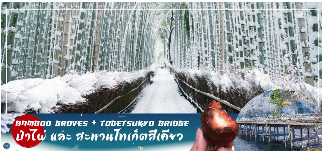
สวนป่าไผ่ และ สะพานโทเก็ตสึเคียว

วันที่สอง ท่าอากาศยานนานาชาติคันไซ โอซาก้า - เมืองเกียวโต - อาราชิยาม่า - สวนป่าไผ่ - สะพานโทเก็ตสึเคียว - เมืองนาโกย่า - ชมงานประดับไฟฤดูหนาว ณ หมู่บ้านนาบานะ โนะซาโตะ