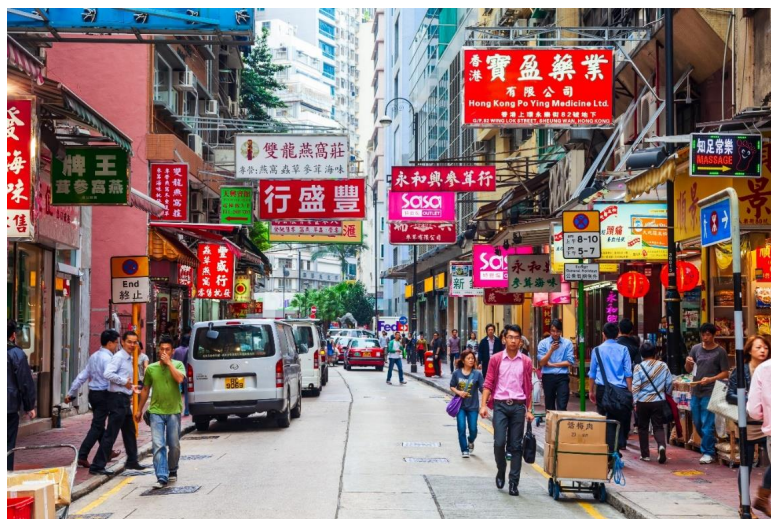
หน้าที่ 4 | ภาพประกอบใช้เพื่อการโฆษณาเท่านั้น

14.00 น. ✈️ เห็นฟ้าสู่ ประเทศฮ่องกง โดยเที่ยวบิน EK 384 บริการอาหารและเครื่องดื่มบนเครื่อง 18.05 น. ถึงสนามบิน CHEK LAP KOK ประเทศฮ่องกง หลังผ่านพิธีการตรวจคนเข้าเมือง อิสระให้ท่านเดินเล่นช้อปปิ้ง ย่านจิมซาจุ่ย ถนนนาธาน ซึ่งเป็นแหล่งรวบรวมสินค้าต่างๆมากมาย ไม่ว่าจะเป็นกระเป๋า รองเท้า น้ำหอม เครื่องสำอางค์ นาฬิกา เสื้อผ้า เครื่องประดับ ทั้งแบรนด์เนมชื่อดังระดับโลกหรือ แบรนด์ท้องถิ่นที่มีชื่อเสียง ณ ที่แห่งนี้ท่านจะได้เลือกซื้อสินค้าประเภทต่างๆ อย่างเต็มอรรถุใจ