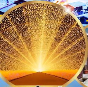
นาบานะ โนะ ซาโตะ