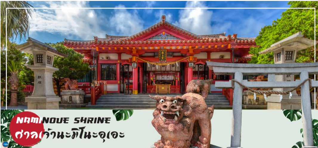
NAMINOUE SHRINE ศาลเจ้านามิโนะอุเอะ

วันที่สี่ ศาลเจ้านามิโนะอุเอะ – อาชิบิโน่า เอาท์เล็ตมอลล์ – ท่าอากาศยานนาฮะ โอกินาว่า – ท่าอากาศยานดอนเมือง กรุงเทพฯ