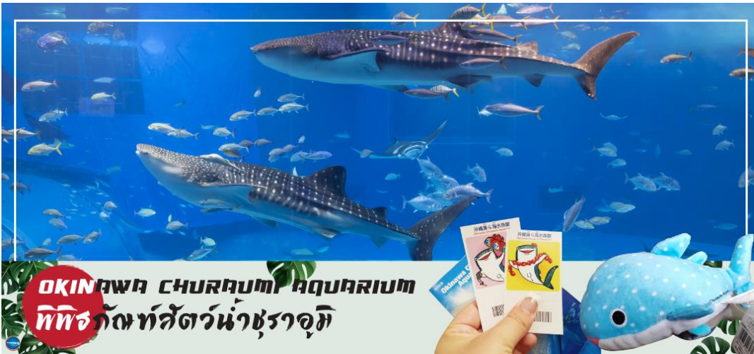
OKINAWA CHURAUMI AQUARIUM พิพิธภัณฑ์สัตว์น้ำชुरาอุมิ

เช้า รับประทานอาหารเช้า ณ ห้องอาหารของโรงแรม (1) นำท่านชม พิพิธภัณฑ์สัตว์น้ำชुरาอุมิ (OKINAWA CHURAUMI AQUARIUM) (ใช้เวลาเดินทางประมาณ 1.40 ชั่วโมง) เป็นพิพิธภัณฑ์สัตว์น้ำที่ดีที่สุดในประเทศญี่ปุ่น ไฮไลท์!!! ของการเยี่ยมชมพิพิธภัณฑ์สัตว์น้ำแห่งนี้คือแห่งก้นน้ำคุโรชิโอะ ซึ่งเป็นหนึ่งใน แห่งก้นน้ำที่ใหญ่ที่สุดของโลก ซึ่งภายในนั้นเต็มไปด้วยสิ่งมีชีวิตในทะเลแถบโอกินาว่าที่หลากหลาย สัตว์น้ำที่โดดเด่นที่สุดคือฉลามวาฬยักษ์ และกระเบนราหู อีสาระให้ท่านได้เพลิดเพลินกับสัตว์น้ำหลากหลายชนิด ทั้ง ปลาตาว ฉลามฉลามเสือ และฉลามวัว ปลาเรืองแสง ตลอดจนหอยต่างๆ นอกจากนี้ยังมีสระน้ำกลางแจ้งที่ตั้งอยู่ใกล้ริมน้ำซึ่งเป็นที่จัดการแสดงของโลมาแสนรู้ เต่าทะเล และพะยูน ที่จัดขึ้นเพียงไม่กี่ครั้งต่อวัน (ไม่มีค่าใช้จ่ายเพิ่มเติม แต่ต้องตรวจสอบเวลาการแสดงก่อนชมนะค่ะ)