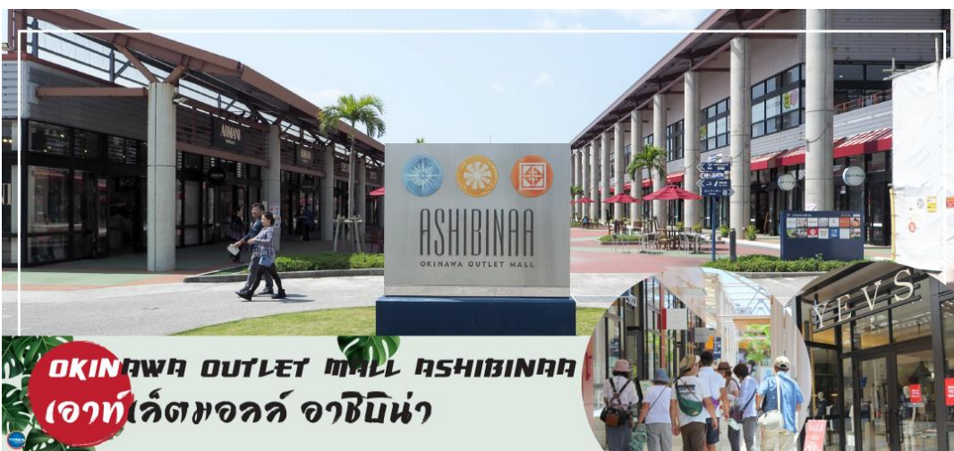
OKINAWA OUTLET MALL ASHIBINAA เอาท์เล็ตมอลล์ อาชิบิโน่า

เช้า รับประทานอาหารเช้า ณ ห้องอาหารของโรงแรม (5) นำท่านเดินทางสู่ ศาลเจ้านามิโนะอุเอะ (Naminoue Shrine) (ใช้เวลาเดินทางประมาณ 10 นาที) ตั้งอยู่ ณ บริเวณที่เป็นพื้นที่ศักดิ์สิทธิ์ที่ใช้ในการสวดภาวนาอธิษฐานต่อเทพเจ้าที่สถิตย์อยู่ ณ อาคารเจ้าสมุทรโพ้นทะเลมาแต่ครั้งโบราณ ในอดีตชาวเรือที่เข้าออก ณ ท่าเรือนาฮะ (Naha Port) ซึ่งขณะนั้นเป็นศูนย์กลางการแลกเปลี่ยนค้าขายกับนานาประเทศ ทั้งจีน ประเทศทางตอนใต้ เกาหลี และชวยามาโตะ มักจะแหงนหน้ามองขึ้นไปยังศาลเจ้าซึ่งตั้งอยู่บนหน้าผาสูงเพื่ออธิษฐาน และแสดงความขอบคุณ ศาลเจ้านามิโนะอุเอะได้รับความเสียหายจากการรบในโอกินาวะ (Battle of Okinawa) เมื่อครั้งสงครามแปซิฟิก แต่ได้รับการบูรณะฟื้นฟูในเวลาต่อมาเมื่อสงครามสิ้นสุดลง ปัจจุบันนี้ได้กลายเป็นศูนย์กลางแห่งศาสนาชินโตในจังหวัดโอกินาวะ ชาวญี่ปุ่นมักจะมาไหว้ขอพรเกี่ยวกับธุรกิจการงานให้เจริญรุ่งเรือง ร่ำรวย และมาสะเดาะเคราะห์ให้พ้นโชคร้าย จากนั้นนำท่านสู่ เอาท์เล็ตมอลล์ อาชิบิโน่า (Okinawa Outlet Mall Ashibinaa) (ใช้เวลาเดินทางประมาณ 30 นาที) เอาท์เล็ตแห่งแรกในโอกินาวะ รวบรวมร้านค้าชั้นนำกว่า 100 ร้าน ทั้งเสื้อผ้าแฟชั่น สินค้าแบรนด์เนม นาฬิกา ข้าวของเครื่องใช้ ของเล่น ทุกร้านจัดเต็มทั้งสินค้ารุ่นเก่าและรุ่นใหม่ ลดราคากระหน่ำกว่า 30-80% ให้ได้เดินช้อปปิ้งตัวยหิ้วกันอย่างจุใจ ภายใต้บรรยากาศสบายๆ สไตล์รีสอร์ทริมทะเล หากช้อปปิ้งเหนื่อยสามารถขึ้นไปทานอาหารที่ชั้น 2 มีอีกหลายร้านที่คอยให้บริการ