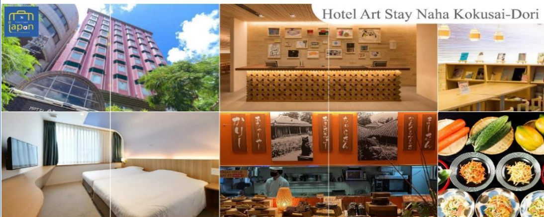
Hotel Art Stay Naha Kokusai-Dori

ที่พัก HOTEL ART STAY NAHA KOKUSAI-DORI หรือเทียบเท่า