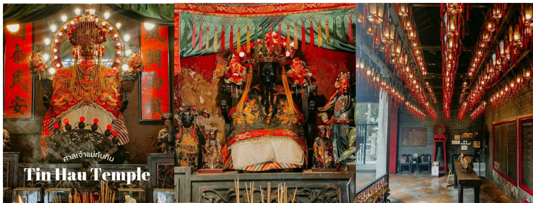
กาลเจ้าแม่กวนอิม Tin Hau Temple

นำท่านเดินทางสู่ วัดหวังต้าเซียน หรือวัดห่องไท่ซินในสำเนียงกวางตุ้ง เป็นวัดที่มีอายุกว่าครึ่งศตวรรษ รายล้อมด้วยอาคารที่พักอาศัยของการเคหะ ตัววัดมีความงดงามด้วยอาคารที่ตกแต่งแบบจีนโบราณ ตั้งอยู่บนไหล่เขาเกาลูน เป็นวัดที่ชาวฮ่องกงเชื่อว่ามีศักดิ์สิทธิ์ และเป็นศูนย์รวมแห่งความเชื่อทางศาสนาถึง 3 ศาสนาด้วยกัน ได้แก่ เต๋า พุทธ และขงจื้อ ในแต่ละวันจะมีผู้คนหลั่งไหลมากราบไหว้ตลอดเวลา โดยเฉพาะนักท่องเที่ยวที่มาเพื่อสักการะขอพรจากท่านมหาเทพ นอกเหนือจากการมาท่องเที่ยวที่นี่