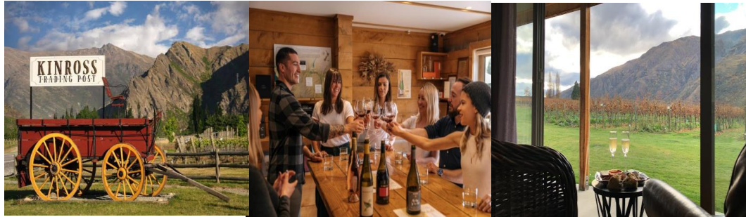
BIG...Amazing New Zealand Tour by SQ 7DN5N- 26 DEC-1 JAN25 - 10-6-24

เที่ยง รับประทานอาหารกลางวันแบบตะวันตก ในไรไวน์