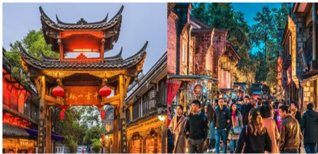
2.Big...Paradise เงินดู-จิวจ่ายโกว-เล่อซาน (B)-SL(เหม่าล่า)-JUL-DEC24 - อัปเดต 8 ก.ค.67

นำท่านสักการะ วัดต้าฉือ ซึ่งอยู่บริเวณติดกันกับถนนไต้หลี่ ซึ่งวัดเก่าแก่แห่งนี้แต่เดิมพระถังซำจั๋งเคยจำพรรษาก่อนเดินทางไปชมพูทวีป จากนั้นนำท่านเที่ยวชม ถนนคนเดินชุนซีไถ่กุหลี่ ช้อปปิ้งคอมเพล็กซ์ ร้านอาหาร ห้างสรรพสินค้าไต้ดิน โรงภาพยนตร์ จัตุรัส และโรงแรมหรูอย่าง The Temple House ครบจบสไตล์จีนโมเดิล