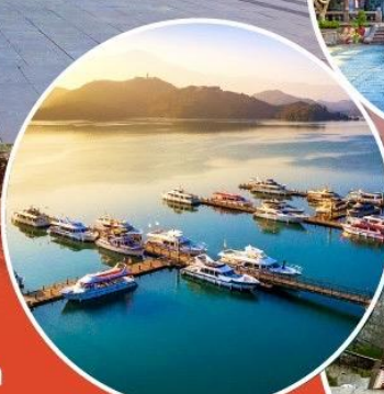
ทะเลสาบสุริยขึ้นจันทรา