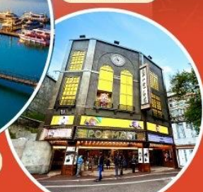
ร้าน POP MART ใหญ่ที่สุดในไต้หวัน