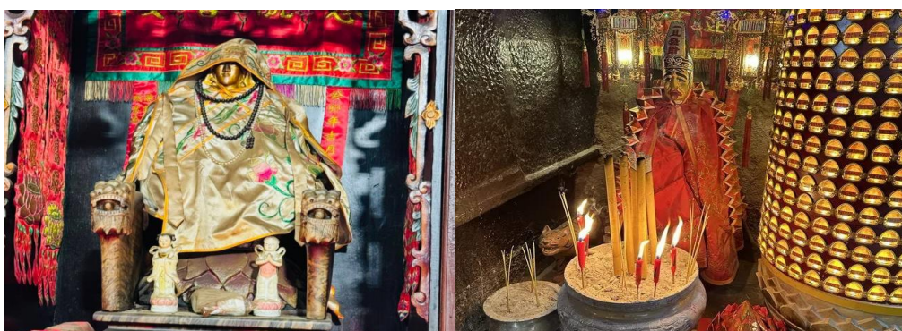
GO1HKG-EK046 อ่องทง มุสคิง รีพัลส์เบย์ แangkหมิว เจ้าแม่กวนอิมฮ่องฮ่า ซ้อบปิ่ง 3 วัน 2 คืน โดยสายการบิน Emirates (EK)

จากนั้นนำท่านเดินทางสู่ วัดหลินฟา (Lin Fa Temple) หรือวังดอกบัว วัดแห่งนี้มีเจ้าแม่กวนอิมเป็นองค์ประธานของวัด โดยเคยมีตำนานเล่าว่าครั้งหนึ่ง เจ้าแม่กวนอิมเคยมาปรากฏตัวที่วัดแห่งนี้ ทำให้ชาวบ้านเลื่อมใสศรัทธา ชาวบ้านจึงรวมใจกันสร้างวิหารดอกบัว และประดับด้วยโคมดอกบัวต่างๆ เพื่อเป็นการสักการบูชา และภายในวัดยังมี เทพเจ้าฮั่วจื่อเอี้ยะ หรือ เทพเจ้าสายนรก เป็นเทพเจ้าที่ขึ้นชื่อเรื่องกตัญญู ที่เปี่ยมไปด้วยพลังหยิน ซึ่งเป็นพลังที่ขึ้นชื่อด้านเงินทองจึงเหมาะอย่างยิ่งสำหรับผู้ที่ชอบเสี่ยงโชค ให้ท่านได้สักการบูชาเสริมความเฮง