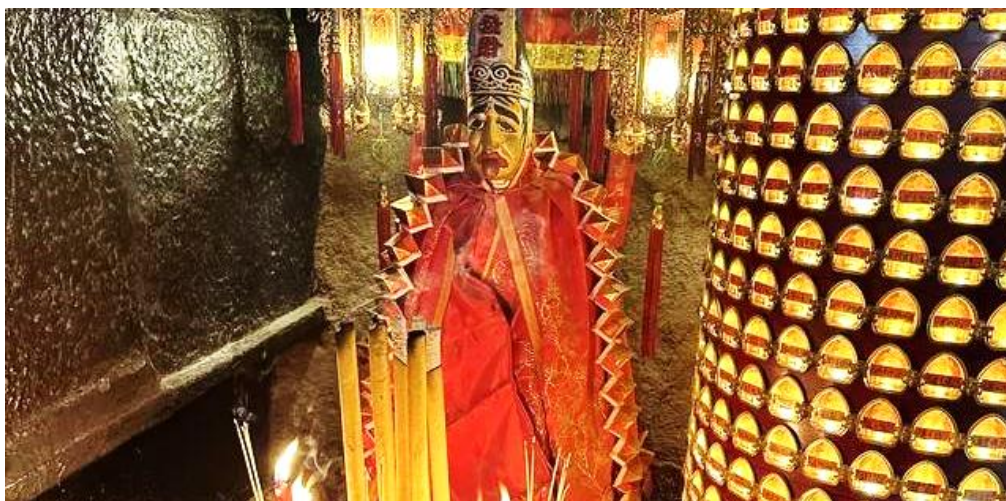
GO1HKG-EK047 ฮองกง เฉินเจิ้น ไหว้พระวัดตั้ง 3 วัน 2 คืน โดยสายการบิน Emirates (EK)

จากนั้นนำท่านเดินทางสู่ วัดหลินฟา (Lin Fa Temple) หรือวังดอกบัว วัดแห่งนี้มีเจ้าแม่กวนอิมเป็นองค์ประธานของวัด โดยเคยมีตำนานเล่าว่าครั้งหนึ่ง เจ้าแม่กวนอิมเคยมาปรากฏตัวที่วัดแห่งนี้ ทำให้ชาวบ้านเลื่อมใสศรัทธา ชาวบ้านจึงรวมใจกันสร้างวิหารดอกบัว และประดับด้วยโคมดอกบัวต่างๆ เพื่อเป็นการสักการบูชา และภายในวัดยังมี เทพเจ้าฮั่วจื่อเอี้ยะ หรือ เทพเจ้าสายนรก เป็นเทพเจ้าที่ขึ้นชื่อเรื่องกตัญญู ที่เปี่ยมไปด้วยพลังหยิน ซึ่งเป็นพลังที่ขึ้นชื่อด้านเงินทองจึงเหมาะอย่างยิ่งสำหรับผู้ที่ชอบเสี่ยงโชค ให้ท่านได้สักการบูชาเสริมความเฮง