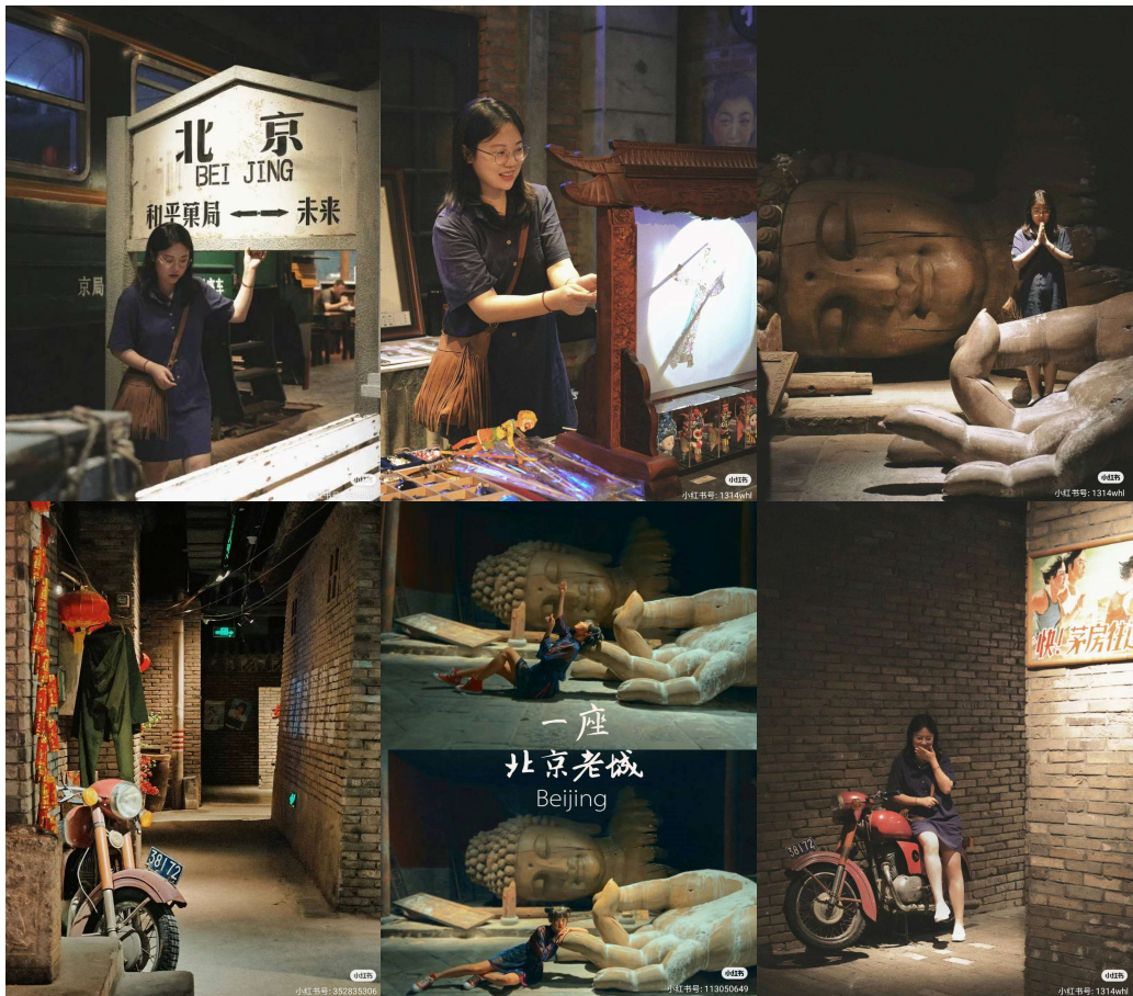
ขอบคุณเจ้าของภาพ (เครดิตตามภาพ)

** ชำระค่าทัวร์ในนามบริษัท ไลออน ทราเวล จำกัด เท่านั้น **