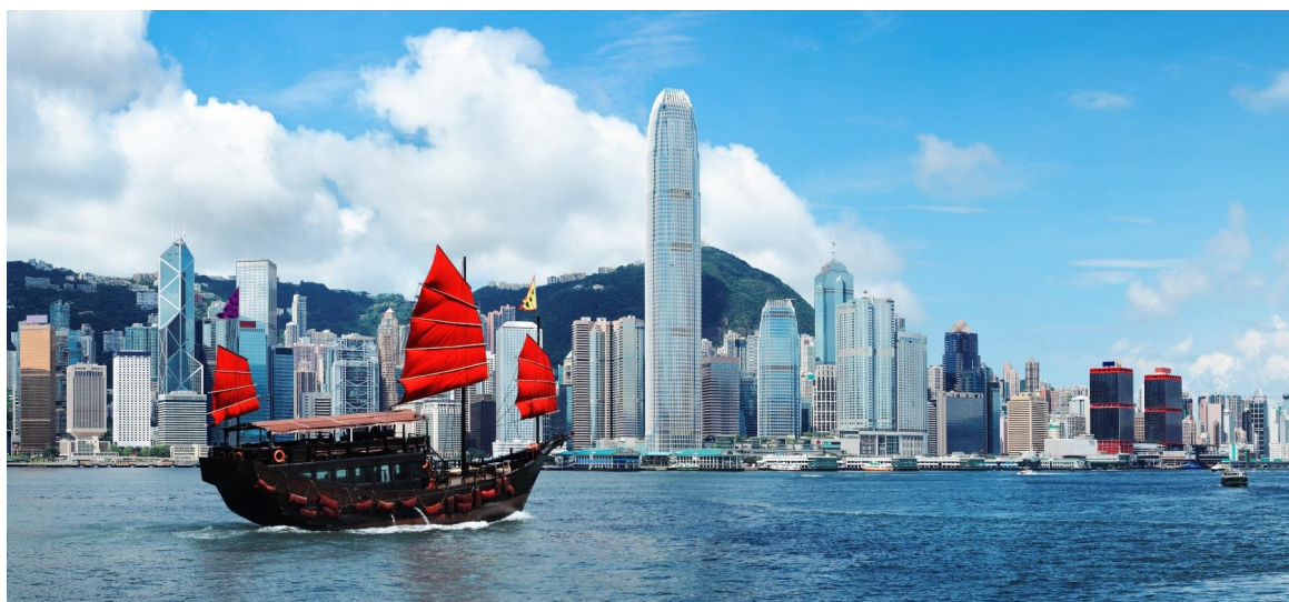
GO1HKG-TG004 ฮ่องกง มุสคัพหลัง นักรบเข่านองปิง ดิสนีย์แลนด์ 4 วัน 3 คืน โดยสายการบิน Thai Airways (TG)

20.40 น. เดินทางถึง สนามบินสุวรรณภูมิ โดยสวัสดิภาพ พร้อมความประทับใจ