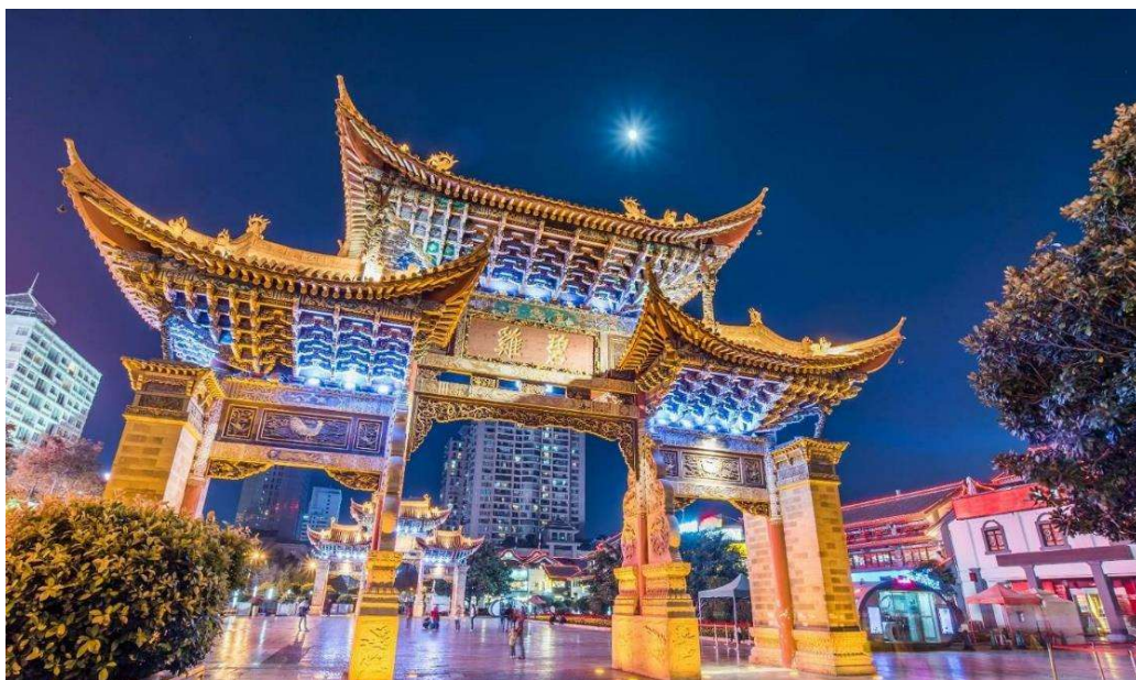
T2G-KMG13MU THE BEST KUNMING คุนหมิง ดำหลี่ ลี่เจียง แซงกริลล่า ภูเขาหิมะมังกรหยก 6D 5N (TG) รถไฟความเร็วสูง 2 ขา