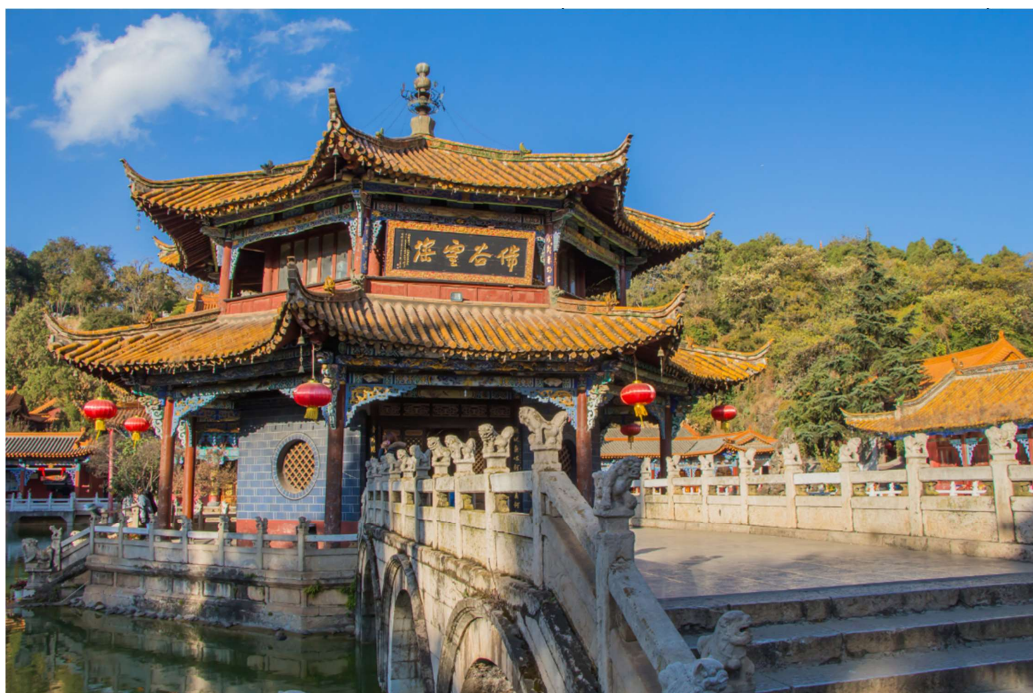
T2G-KMG13MU THE BEST KUNMING คุนหมิง ดำหลี่ ลี่เจียง แซงกริลล่า ภูเขาหิมะมังกรหยก 6D 5N (TG) รถไฟความเร็วสูง 2 ขา

จากนั้นนำท่านเดินทางสู่ วัดหยวนตง (Yuantong Temple) วัดแห่งนี้เป็นวัดที่ใหญ่และเก่าแก่ที่สุดในเมืองคุนหมิง สร้างมาตั้งแต่สมัยราชวงศ์ถังมีอายุยาวนานประมาณ 1,200 กว่าปี แต่การสร้างวัดแห่งนี้ดูแล้วจะแปลกตากว่าวัดอื่นๆในจีน เพราะปกติแล้วการสร้างวัดของจีนส่วนมากจะต้องสร้างอยู่บนภูเขา แต่วัดหยวนตงสร้างวัดต่ำกว่าภูเขา โดยวิหารจะอยู่ต่ำที่สุด เนื่องจากวัดแห่งนี้ไม่ได้สร้างขึ้นเพื่อเป็นวัดโดยตรง แต่เคยเป็น