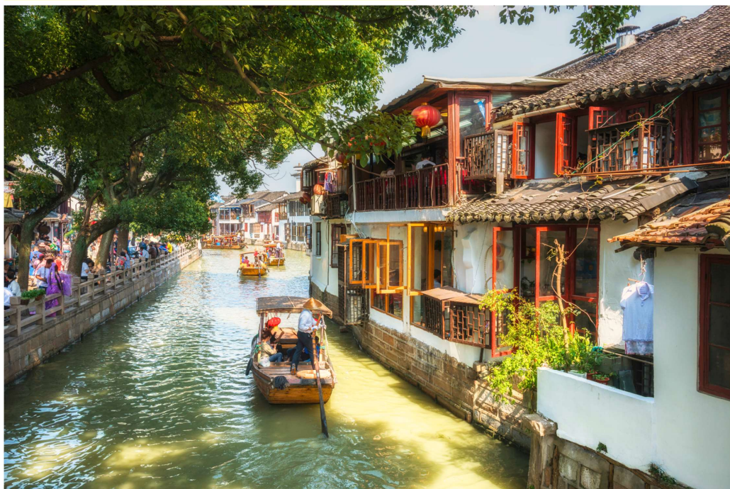
T2G-PVG01CA HIGHLIGHT OF SHANGHAI...เซี่ยงไฮ้ ดิสนีย์แลนด์ ลอดดูโม่งค์เลเซอร์ 4D 2N (CA)

เช้า รับประทานอาหารเช้า บนรถบัส = แสมเบอร์เกอร์