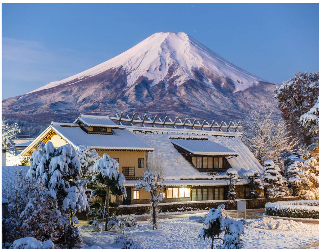
T2G-KIXHND03TG Osaka Tokyo Disneyland...โอซาก้า ชิราคาวาโกะ ฟุจิ โตเกียว ดิสนีย์แลนด์ 7D 4N (TG)