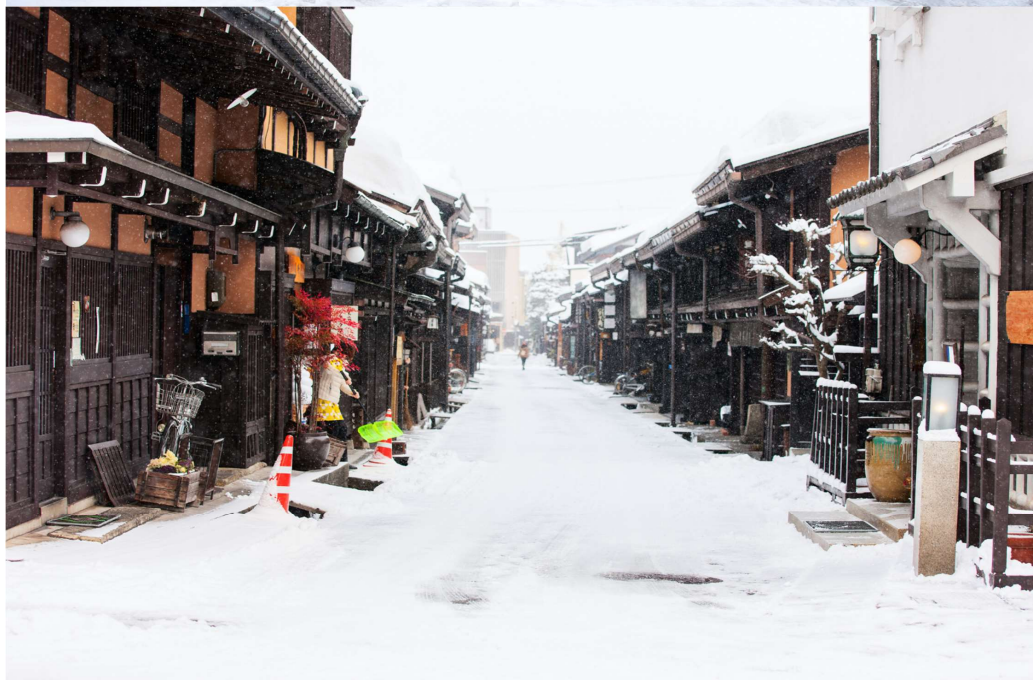
T2G-KIXHND03TG Osaka Tokyo Disneyland...โอซาก้า ชิราคาวาโกะ ฟุจิ โตเกียว ดิสนีย์แลนด์ 7D 4N (TG)

** ชำระค่าทัวร์ในนามบริษัท ไลออน ทราเวล จำกัด เท่านั้น **