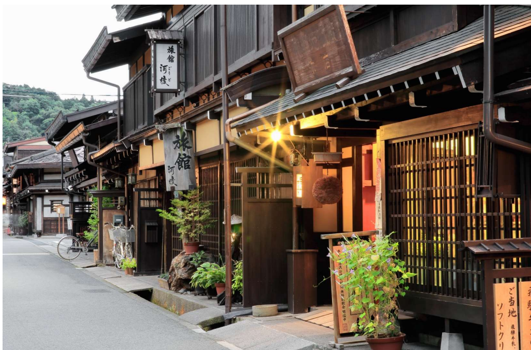
T2G-KIXHND02TG Popular Osaka Tokyo ...โอซาก้า ภูมิภาคคันไซ ชิราคาวาโกะ ฟุจิ โตเกียว 7D 4N (TG)

** ชำระค่าทัวร์ในนามบริษัท ไลออน ทราเวล จำกัด เท่านั้น **