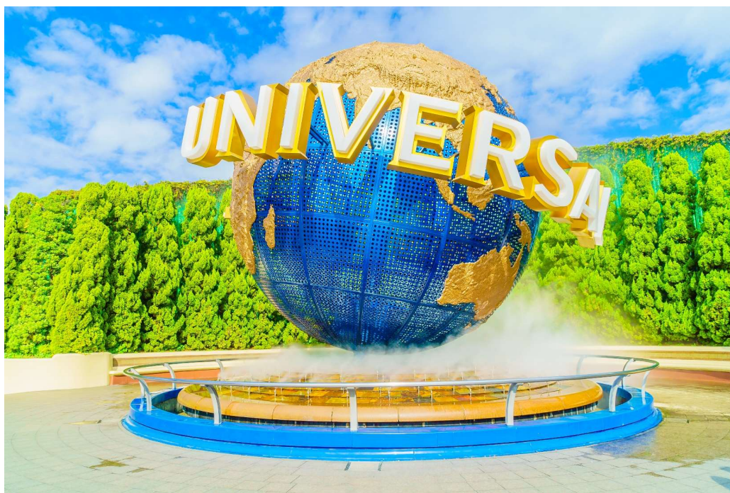
T2G-KIXHND02TG Popular Osaka Tokyo ...โอซาก้า ยูนิเวอร์แซล ชิราคาวาโกะ พูจิ โดเกียว 7D 4N (TG)

** ชำระค่าทัวร์ในนามบริษัท ไลออน ทราเวล จำกัด เท่านั้น **