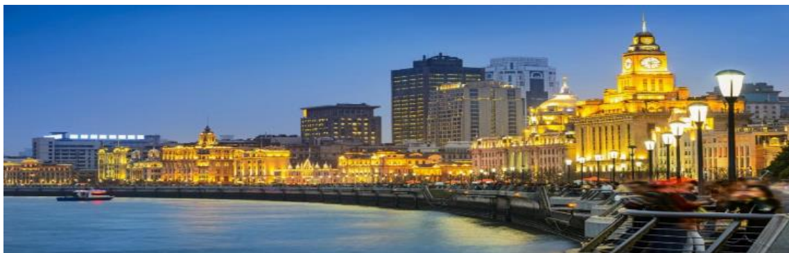
GO1PVG-CA005 ตะลอนเซี่ยงไฮ้ ปักกิ่ง 6วัน 4คืน (นั่งรถไฟความเร็วสูง) โดยสายการบิน Air China (CA)

01.40 น. ออกเดินทางสู่ เซี่ยงไฮ้ โดยสายการบิน Air China เที่ยวบินที่ CA806 07.00 น. เดินทางถึง ท่าอากาศยานนานาชาติเซี่ยงไฮ้ผู่ตง ประเทศจีน เวลาท้องถิ่นเร็วกว่าประเทศไทย 1 ชั่วโมง (เพื่อความสะดวกในการนัดหมาย กรุณาปรับนาฬิกาของท่านเป็นเวลาท้องถิ่น) หลังจากท่านได้ผ่านพิธีการตรวจคนเข้าเมืองและศุลกากร