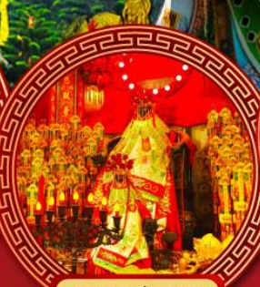
วัดเจ้าแม่กวนอิม ช่องฮ่า