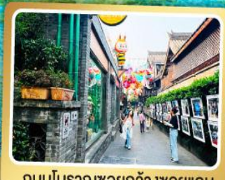
ถนนโบราณชอยกวางชอยแคบ