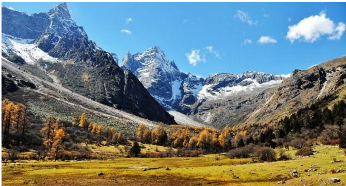
GO1TFU-TG012 เฉิงตู หวงหลง จิวจ้ายโกว ภูเขาสี่ดรุณี 6วัน 5คืน โดยสายการบิน Thai Airway (TG)

จากนั้นนำท่านเดินทางสู่ ภูเขาสี่ดรุณี(รวมรถอุทยาน) “สี่ดรุณี” หรือ ชื่อภูเขาหนึ่งชาน ตั้งอยู่ในมณฑลเสฉวน ประเทศจีน เป็นยอดเขา 4 ลูกที่เรียงรายติดต่อกันไปจากทิศเหนือถึงทิศใต้เป็นระยะทาง 3.5 กิโลเมตร โดยมีความสูงเหนือระดับน้ำทะเลแบ่งเป็น 6,250 เมตร/ 5,664 เมตร/ 5,454 เมตร และ 5,355 เมตร บนยอดเขาทั้ง 4 แห่งนี้จะมีหิมะปกคลุมตลอดทั้งปี ทำให้ดูเหมือนส่วนสี่ระฆังที่คลุมด้วยผ้าสีขาวของหญิงสาว 4 คน จึงเป็นที่มาของชื่อ “ภูเขาสี่ดรุณี” นั่นเองพื้นที่บริเวณภูเขาสี่ดรุณีนั้นเป็นพื้นที่ขึ้นหินแบบยุคโบราณ, เพราะเหตุผลที่ว่า ยอดเขามีลักษณะแปลกที่พบเห็นได้น้อย, บนยอดเขามีหิมะปกคลุมตลอดปี, ทำให้ได้รับฉายาว่า “ราชินีแห่งดินแดนเสฉวน” หรือ “ภูเขาศักดิ์สิทธิ์แห่งดินแดนทางทิศตะวันออก” มียอดเขาที่มีระดับความสูงน้ำทะเลสูงเกิน 5000 เมตร ถึง 61 ลูก, รอยต่อระหว่างภูเขามียอดบึงทะเลสาบอยู่ถึง 25 แห่ง มีน้ำตกอยู่ 120 กว่าแห่ง