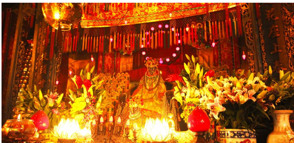
GO1MFM-NX009 มาเก๊า ฮ่องกง เสริมโชคชัยทรัพย์ เปิดทองพระคลังเจ้าแม่กวนอิมฮ่องกง 3 วัน 2 คืน (พัก 5 คืน) โดยสายการบิน Air Macau (NX)

วันเปิดทองพระคลัง หรือ วันเปิดทรัพย์ สำหรับปี 2568 จะตรงกับวันที่ 23 กุมภาพันธ์ 2568 (ในแต่ละปีจะไม่ตรงกันเพราะนับจากการคำนวณตามปฏิทินจันทรคติจีน) ซึ่งทางวัดจะมีการจัดทำพิธีขอยืมเงินเจ้าแม่กวนอิม ขอพรด้านเงินทอง ความเจริญมั่งมีมั่งคั่งในชีวิต ให้ท่านได้ร่วมพิธีการศักดิ์สิทธิ์และเก่าแก่ของชาวฮ่องกงที่สืบทอดกันมา โดย 1 ปี จะมีเพียง 1 ครั้ง และในวันนี้จะมีผู้คนหลั่งไหลกันเข้ามาไหว้ขอพรกันเป็นจำนวนมาก ทั้งชาวฮ่องกงเอง ชาวจีนแผ่นดินใหญ่ รวมถึงนักท่องเที่ยวต่างชาติ ต่างก็มารอคิวข้ามคืนเพื่อต้องการเข้าร่วมทำพิธีกันอย่างมากมาย