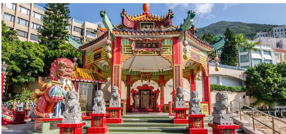
GO1HKG-TG001 ช่องกม เสริมดวงเศรษฐี เปิดท้องพระคลังเจ้าแม่กวนอิมฮ่องกง 4 วัน 3 คืน โดยสายการบิน Thai Airways (TG)

นำท่านเดินทางสู่ หาดรีพัลส์เบย์ (Repulse Bay) นำท่านขอพรเจ้าแม่กวนอิม หนึ่งในเทพที่ชาวฮ่องกงให้ความเคารพนับถืออย่างมาก ไม่ว่าจะขอพรสิ่งใดก็จะสมความปรารถนาทั้งสิ้น เริ่มต้นด้วยการ เดินเข้าวัดด้วยเท้าซ้าย และออกด้วยเท้าขวา เป็นเคล็ดลับที่ชาวฮ่องกง และคนจีนบอกว่าคล้ายกับการเดินของเซ็มนาฟิกา ซึ่งจะทำให้ชีวิตเจริญก้าวหน้านั่นเอง ก่อนที่จะเดินเข้าวัดให้แวะเสริมดวงแห่งโชคลาภได้ด้วยการ ลูบลูกแก้วในปากสิงโตด้านหน้าวัด เพื่อให้มีแต่ความโชคดี หากเดินทางเข้ามาภายในวัดแล้วด้านซ้ายมือ จะเป็นที่ประดิษฐานเจ้าแม่กวนอิม และด้านขวามือ จะเป็นที่ประดิษฐานเจ้าแม่ทับทิม หรือเจ้าแม่ทินเห่า เชื่อว่าเป็นเทพแห่งท้องทะเลที่คอยปกป้องรักษาชาวประมงและยังเป็นเทพแห่งโชคลาภ สามารถขอพรกับเจ้าแม่กวนอิมปางประทานพร, ขอพรให้ป้องกันจากภัยอันตราย กับเจ้าแม่ทับทิม, ขอโชคลาภความมั่งคั่งกับเทพเจ้าไฉ่ซิงเอี้ย, ขอลูกกับพระสังกัจจายน์โพธิสัตว์, เดินข้ามสะพานต่ออายุ, ขอพรเรื่องการเงิน และธุรกิจจากเหรียญเงินโบราณแดงโชคลาภ และยังสามารถขอพรเทพเจ้าความรักได้ด้วย เรียกว่ามาที่เดียวได้ขอพรกันครบเลย ไม่ว่าจะใครจะขอพรอันใดก็สมหวัง สมความปรารถนาทุกประการ