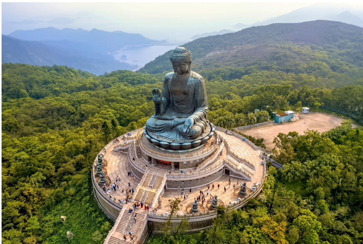
GO1HKG-TG001 ฮ่องกง เสริมดวงเศรษฐี เปิดท้องพระคลังเจ้าแม่กวนอิมฮ่องฮ่า 4 วัน 3 คืน โดยสายการบิน Thai Airways (TG)

20.40 น. เดินทางถึง สนามบินสุวรรณภูมิ โดยสวัสดิภาพ พร้อมความประทับใจ