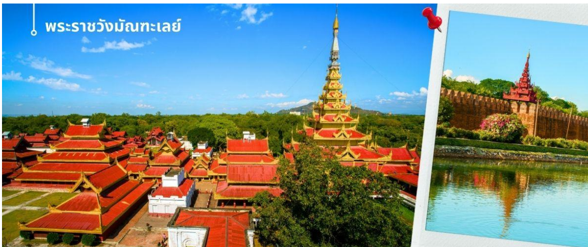
พระราชวังมณฑลเลย

อังกฤษเปลี่ยนบริเวณพระราชวังเป็นป้อมดัดฟ้าพริ่นซึ่งตั้งชื่อตามผู้สำเร็จราชการอินเดียในขณะนั้น ตลอดยุคอาณานิคมของอังกฤษชาวพม่ามองว่าพระราชวังแห่งนี้เป็นสัญลักษณ์หลักของอหิปไตยและอัตลักษณ์ บริเวณพระราชวังส่วนใหญ่ถูกทำลายในช่วงสงครามโลกครั้งที่สองโดยการทิ้งระเบิดของฝ่ายสัมพันธมิตร มีเพียงโรงกษาปณ์และหอสังเกตการณ์เท่านั้นที่เหลือรอด พระราชวังจำลองถูกสร้างขึ้นใหม่ในช่วงพ.ศ. 2533 ด้วยวัสดุที่ทันสมัย ปัจจุบันพระราชวังมณฑลเลยเป็นสัญลักษณ์หลักของมณฑลเลยและเป็นสถานที่ท่องเที่ยวที่สำคัญ