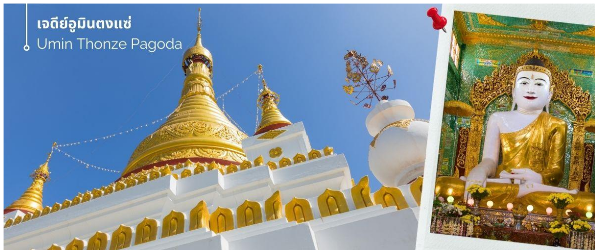
เจดีย์อุมินตงแซ่

จากนั้นนำท่านชม เจดีย์อุมินตงแซ่ ขอพร พระทันใจ (Umin Thonze Pagoda) ตั้งอยู่ที่ตอยสุริยะอุมินตงแซ่ อยู่ทางเหนือประมาณ 1200 เมตร เป็นวัดผสมผสานที่มีชื่อเสียงที่สุดคือ ทางเดินรูปพระจันทร์เสี้ยว ภายในมีพระพุทธรูป 45 องค์ ทางเดินรูปพระจันทร์เสี้ยวทั้งหลังมีซุ้มประดับประดาสวยงามทั้งหมด 30 ซุ้ม หมายถึง ถ้าที่พระสงฆ์หนึ่งสมาธิ ส่วนชื่อวัด อุมิน แปลว่า ถ้า ตงแซ่ หมายถึง 30 ด้าน ด้านข้างทางเดินมีพระวิหารสี่เหลี่ยม ภายในประดิษฐานพระพุทธรูปขนาดต่างๆ กว่าสิบองค์ บนเนินเขาด้านหลังทางเดินยังมีกลุ่มพระอุโบสถและเจดีย์ที่มองเห็นทิวทัศน์ที่สวยงามของภูเขาสุริยะและแม่น้ำอิรวดี