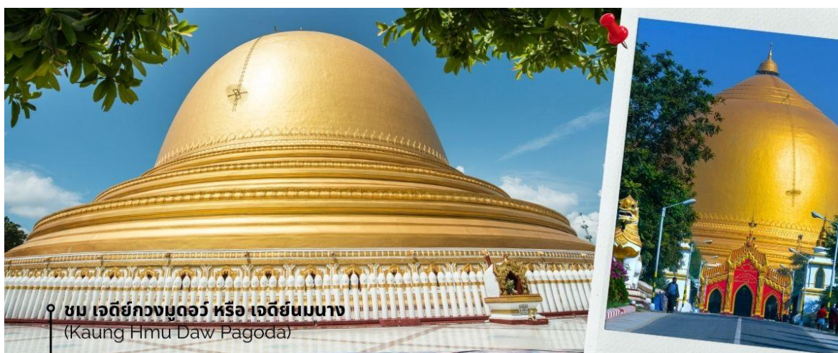
ชม เจดีย์กวงมุดอว์ หรือ เจดีย์นมนาง (Kaung Hmu Daw Pagoda)

นำท่านชม เจดีย์กวงมุดอว์ หรือ เจดีย์นมนาง (Kaung Hmu Daw Pagoda) เป็นเจดีย์พุทธขนาดใหญ่ ตั้งอยู่เขตชานเมืองทางตะวันตกเฉียงเหนือของชะไค้ โดยจำลองตามสัณนิบาตมหาเจดีย์ ในประเทศศรีลังกา ฐานชั้นล่างสุดของเจดีย์ประดับด้วยนระและเทวดา 120 องค์ ล้อมรอบด้วยโคมหิน 802 ต้น ซึ่งแกะสลักพร้อมจารึกพุทธประวัติสามภาษาได้แก่ พม่า, มอญ และไท