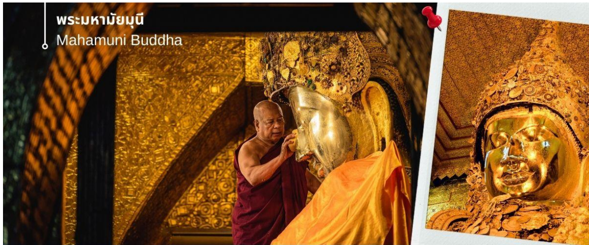
พระมหาชัยมุณี Mahamuni Buddha

เป็นพระพุทธรูปที่มีชีวิต ด้วยเหตุที่ได้รับประทานพร หรือบางตำนานก็กล่าวว่าได้รับประทานลมหายใจจากพระพุทธเจ้า จึงมีประเพณีล้างพระพักตร์ถวายโดยทุกเช้าในเวลาประมาณ 04.00 น. พระมหาเถระและสาธุชนทั่วไปที่ศรัทธาจะมาทำพิธีล้างพระพักตร์ด้วยน้ำอบน้ำหอมผสมทานาคาอย่างดี พร้อมกับใช้แปรงทองแปรงที่พระโอษฐ์เสมือนหนึ่งแปรงพระทนต์ถวายพระพุทธเจ้า ก่อนใช้ผ้าจากศรัทธาสาธุชนที่ถวายมาเช็ดจนแห้งสนิท แล้วนำกลับคืนแก่สาธุชนผู้นั้นไปบูชาต่อ พร้อมใช้พัดทองโบกถวายเป็นอันดี เสมือนหนึ่งได้อุปัฏฐากองค์สมเด็จพระสัมมาสัมพุทธเจ้าที่ยังทรงพระชนม์ชีพอยู่ พระมหาชัยมุณีมีอีกพระนามหนึ่งว่า "พระเนื่อนิ่ม" ซึ่งเกิดจากการปิดทองซ้ำแล้วซ้ำอีกจนเป็นรอยย่นตะปุ่มตะป่ำไปทั่วทั้งองค์ ซึ่งหากเอานิ้วกดลงไปจะรู้สึกได้ถึงความอ่อนนุ่มของทองคำเปลวที่ปิดทับซ้อนกันนับเป็นพัน ๆ ชั้น ๆ ขึ้น สมควรแก่เวลานำท่านเดินทางกลับเข้าสู่ที่พัก