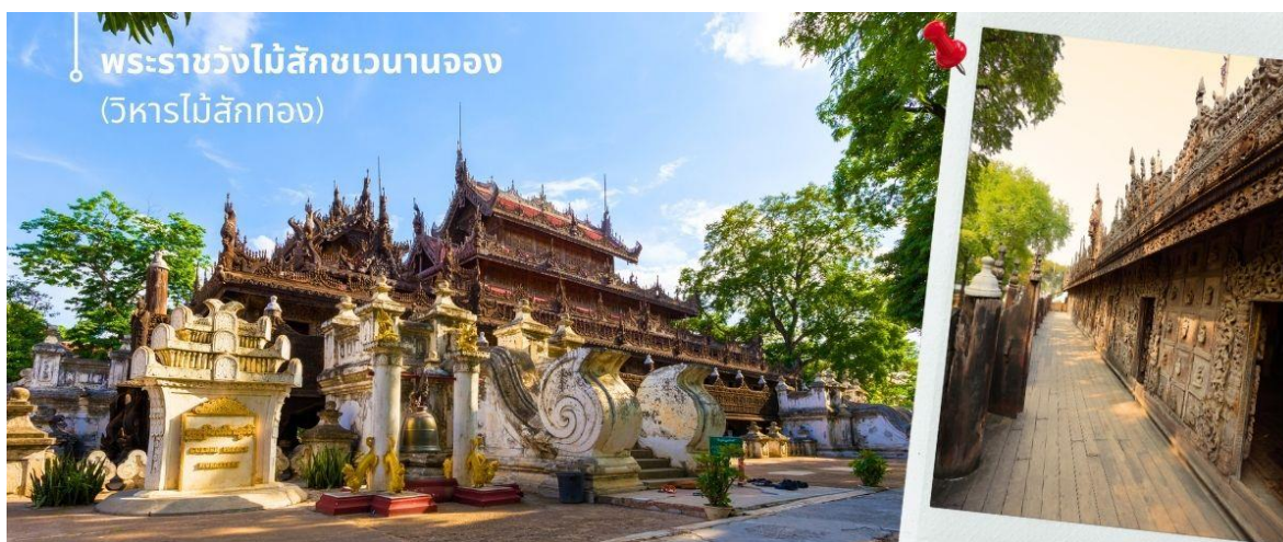
พระราชวังไม้สักขเวนาจอง (วิหารไม้สักทอง)

นำทุกท่านเยี่ยมชม พระราชวังไม้สักขเวนาจอง (วิหารไม้สักทอง) เดิมวิหารหลังนี้เป็นส่วนหนึ่งของพระราชวังอมรปุระ ก่อนที่จะถูกย้ายมายังมณฑลเลย ซึ่งสร้างในพื้นที่ตอนเหนือของพระราชวังแก้ว และเป็นพระตำหนักประทับส่วนหนึ่งของกษัตริย์ตัวอาคารปิดทองอย่างหนาแน่นและประดับด้วยงานโมเสกแก้ว วิหารแห่งนี้โดดเด่นเรื่องงานไม้สักแกะสลักเรื่องราวทางพุทธศาสนา ซึ่งประดับอยู่ที่ผนังและหลังคา วิหารแห่งนี้สร้างขึ้นในสไตล์สถาปัตยกรรมพม่าแบบดั้งเดิม เป็นอาคารหลักของพระราชวังเดิมเพียงแห่งเดียวที่เหลืออยู่ในปัจจุบัน สร้างขึ้นใน พ.ศ. 2421 โดยพระเจ้าสีป่อ ซึ่งรื้อถอนและย้ายพระตำหนักของพระเจ้ามินดง พระราชบิดาซึ่งครอบครองก่อนสวรรคต พระเจ้าสีป่อได้รื้อพระตำหนักออกเมื่อวันที่ 10 ตุลาคม พ.ศ. 2421 โดยเชื่อว่ามีความวิญญานของพระราชบิดาสิงอยู่ การบูรณะวิหารหลังนี้เสร็จสิ้นวันที่ 31 ตุลาคม พ.ศ. 2421 เพื่ออุทิศแด่พระราชบิดา