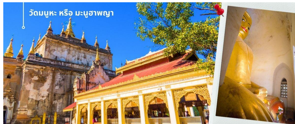
วัดมธุระ หรือ มธุระอาพญา

จากนั้นนำท่านชม วัดมธุระ หรือ มธุระอาพญา เป็นวัดและโบราณสถานที่สร้างโดยพระเจ้ามธุระ กษัตริย์มอญแห่งอาณาจักรสุธรรมวดี ขณะที่พระองค์ทรงถูกจองจำในเมืองพุกามในรัชสมัยพระเจ้าอโนราธามังช่อ ปัจจุบันตั้งอยู่ในเขตมณฑลพะเยา ประเทศพม่า ตามประวัติได้เล่าว่าพระเจ้าอโนราธามังช่อ กษัตริย์พุกาม ได้ทรงทำสงครามกับอาณาจักรสุธรรมวดี เมืองหลวงของมอญและได้รับชัยชนะ จึงทรงกวาดต้อนกษัตริย์แห่งสุธรรมวดีคือพระเจ้ามธุระมาจองจำในเมืองพุกาม โดยไม่ให้อิสระอะไรมากนัก ต่อมาพระองค์ได้ทรงมีพระบรมราชานุญาตให้พระเจ้ามธุระสร้างวัดเพื่อเป็นสถานที่บำเพ็ญพระราชกุศล ซึ่งคือวัดมธุระแห่งนี้ พระองค์จึงทรงระบายนความคับแค้นพระทัยผ่านการสร้างวัดโดยทรงสร้างให้พระประธานปางขัดสมาธิในวิหารมีขนาดใหญ่จนพระองค์ (โหล) ของพระพุทธรูปขัดติดกับผนังทั้งสองข้างและมีลักษณะอืดอืด ชาวไทยจึงรู้จักกันในนาม พระอืดอืด นอกจากพระพุทธรูปปางสมาธิแล้วในอีกวิหารหนึ่งยังมีพระพุทธรูปปางไสยาสน์เสด็จดับขันธปรินิพพาน ซึ่งถูกสร้างในลักษณะที่ดูอืดอืดเช่นกัน โดยมีพุทธลักษณะทรงยิ้ม นักโบราณคดีบางกลุ่มตีความว่าพระเจ้ามธุระทรงจะสื่อว่า ความตาย (พระนิพพาน) เท่านั้น จะช่วยให้เราหลุดพ้นได้