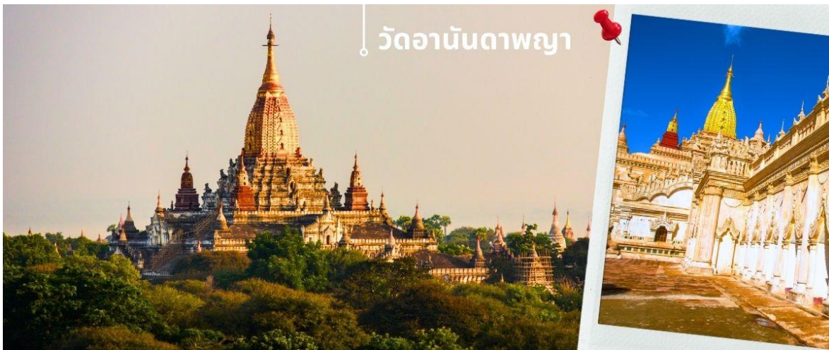
วัดอานันดาพญา

จากนั้นนำท่านนมัสการ วัดอานันดาพญา คือมหาวิหารขนาดใหญ่ที่ตั้งอยู่ในเมืองพุกาม ประเทศพม่า เริ่มสร้างขึ้นใน พ.ศ. 1633 แล้วเสร็จในปีต่อมา ในรัชกาลพระเจ้าจันชิตา มีความสำคัญในฐานะได้รับการยกย่องว่าเป็น "เพชรน้ำเอกของพุทธศิลป์ สกุลช่างพุกาม" ในอดีตยอดพระเจดีย์ยังเป็นสีขาวเหมือนกับพระเจดีย์องค์อื่นๆ ของพุกาม แต่รัฐบาลพม่าได้มาทาสีทองทับเมื่อ พ.ศ. 2533 เพื่อสมโภชการสร้างวัดอานันดาพญา ครบรอบ 900 ปี อานันดาพญา เป็นพระเจดีย์ที่สามารถเดินเข้าไปข้างในได้ แผนผังเป็นรูปสี่เหลี่ยมจัตุรัสมีมุขยื่น 4 ทิศ ประตูทางเข้าเป็นประตูโค้ง ที่มักพบเห็นในสถาปัตยกรรมตะวันตกมากกว่า ตะวันออก ภายในประดิษฐานพระพุทธรูปประทับยืนไม้ปิดทอง สีที่ศ สีสองค์ สูง 9.5 เมตร