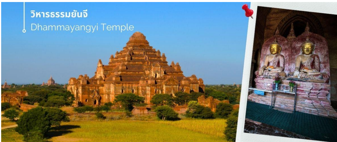
วิหารธรรมยันจี Dhammayangyi Temple

จากนั้นชม วิหารธรรมยันจี (Dhammayangyi Temple) เป็นวัดในเมืองพุกาม ประเทศพม่า เป็นวัดขนาดใหญ่ที่สุดในพุกามสร้างในรัชกาลพระเจ้านระตุ กษัตริย์แห่งราชวงศ์พุกาม ได้ชื่อว่าเป็นผู้โหดร้ายและเป็นจุดเริ่มต้นความเสื่อมของอาณาจักรพุกาม มีพระนามที่เป็นที่รู้จักอีกพระนามหนึ่งว่า "อิมตอวสยัน" ที่ได้ชื่อว่าเป็นกษัตริย์จอมโหด เนื่องจากทรงลอบปลงพระชนม์พระบิดาคือ พระเจ้าออลองสิธู และพระเจ้ามินซินสอ พระเชษฐา เพื่อขึ้นครองราชย์ จึงเชื่อกันว่าทรงสร้างวัดอันใหญ่โตนี้เพื่อไถ่บาปของพระองค์เอง