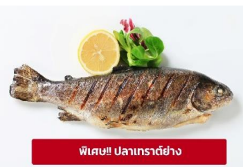
พิเศษ! ปลาเทราต์ย่าง

นำท่านเดินทางสู่ เมืองลินซ์ (Linz) (ระยะทาง 125 กม./ 2 ชม.) เป็นเมืองที่มี การผลิตเหล็ก เครื่องจักร อุปกรณ์ไฟฟ้า อดีตเป็นศูนย์กลางการค้าที่สำคัญ ให้ท่านถ่ายรูปบริเวณด้านนอก พิพิธภัณฑ์แห่งโลกอนาคต (Ars Electronica Center) ตั้งอยู่ริมแม่น้ำดานูบ เป็นที่จัดแสดงวิทยาการต่างๆ ที่ส่งผลต่อมวล มนุษย์ปัจจุบัน ไม่ว่าจะเป็นอวกาศ หุ่นยนต์และเอไอ ยารักษาโรค เป็นต้น