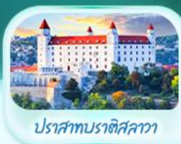
ปราสาทปราติสลาวา

เที่ยวชมเมืองฮัลล์สตัดท์ หมู่บ้านริมนทะเลสาบสวยที่สุดในโลก พระราชวังเชินบรุนน์ เมืองลินซ์ จักร์สฮาพท์พลักซ์ สัมผัสเมืองมรดกโลก เซสท์ ครุมลอฟ เยือนชมปราสาทปราก ถนนทองคำ เช็กอินสถานที่ชื่อดัง ปราสาทปราติสลาวา ส่องเรือชมความงามแม่น้ำดานูบ แม่น้ำที่สวยงามที่สุดในยุโรป ชมความน่าหลงใหลของ ปราสาทบูคาเปสต์ สะพานชาร์ลส์