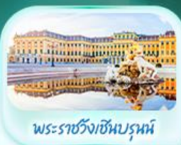
พระราชวังเชินบรุนน์